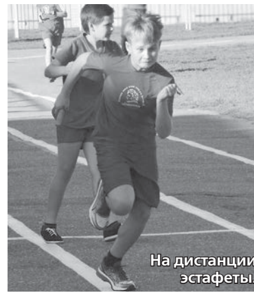
На дистанции эстафеты.

А после сигнального выстрела импровизированные трибуны выплеснули прямо-таки бурю спортивных эмоций, поболеть за спортсменов и вспомнить выдающегося офицера и гражданина пришли ветераны подразделений, служившие в «горячих точках», студенты – бывшие выпускники «кадетки», представители спортивной общественности и неравнодушные жители и гости столицы Ставропольского края.