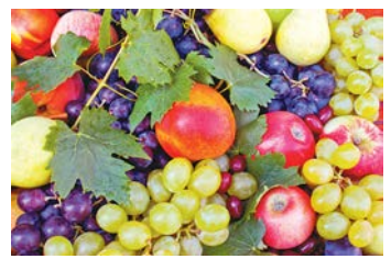
График работы ярмарки: с 8:00 до 16:00.

Сегодня, 19 октября, по адресу: ул. Куйбышева, 48, пройдет традиционная ярмарка «Покупай ставропольское!». На ней местные сельхозпроизводители представят сезонные фрукты, овощи, мясную и молочную продукцию.