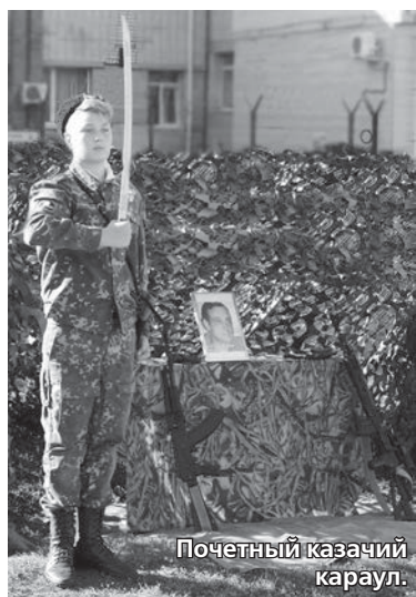
Почетный казачий караул.