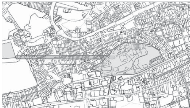
СХЕМА границ территории подготовки изменений в документацию по планировке государственной историко-культурной заповедной территории «Крепостная гора» (проект планировки) в городе Ставрополе, утвержденную постановлением администрации города Ставрополя от 01.09.2015 № 1946, и подготовки документации по планировке государственной историко-культурной заповедной территории «Крепостная гора» (проекта межевания территории) в городе Ставрополе