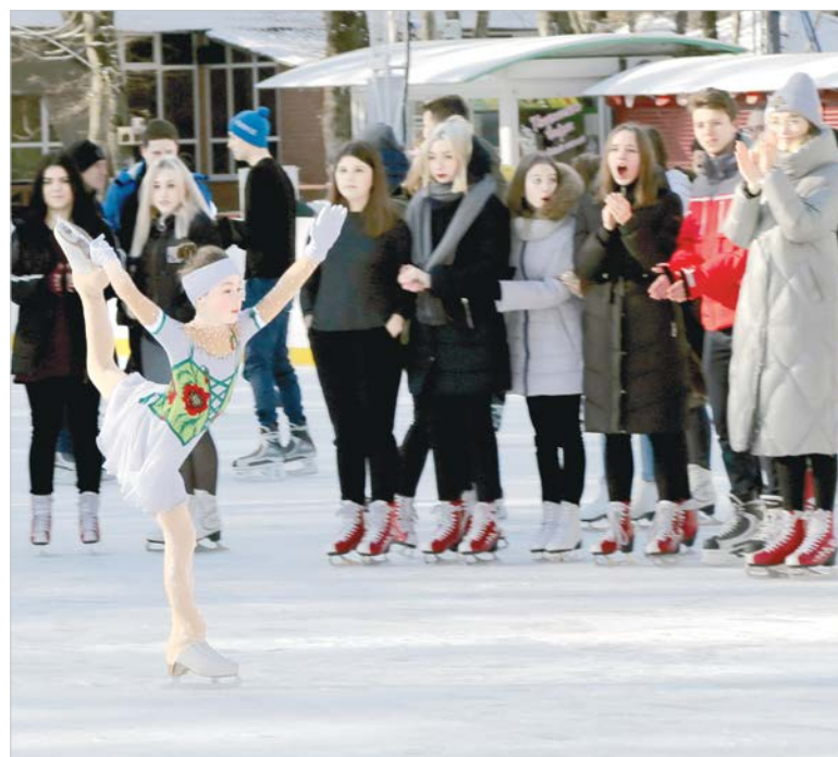
На открытии катка выступили юные фигуристы.

В минувший четверг в Ставропольском парке Победы официально открыли ледовый каток. Напомним, что он является одним из самых больших среди открытых ледовых арен на Юге России и крупнейшим в Ставрополе.