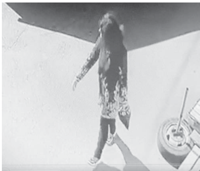
Подозреваемая идет к месту, где она оставит ребенка.

По данным краевого управления СКР, в отношении женщины возбуждено уголовное дело по факту покушения на убийство своего новорожденного ребенка. Кроме того, следствием инициирован вопрос об изъятии у подозреваемой двух старших детей и лишении ее родительских прав.