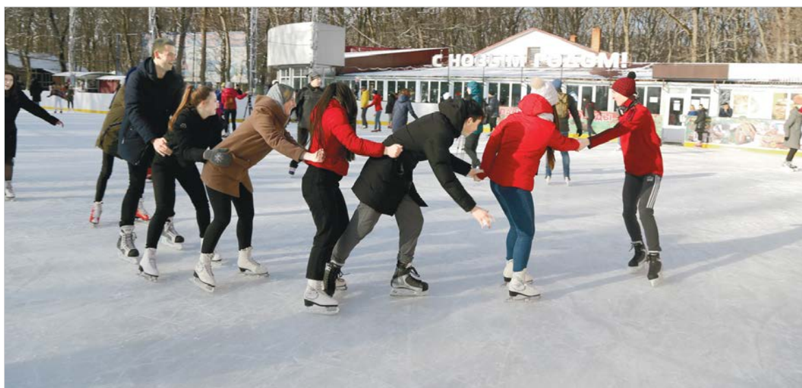
«Паровозиком» кататься веселее.