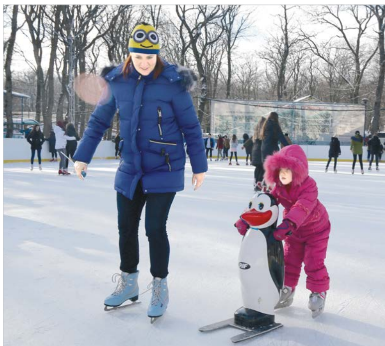
В прокате можно взять не только коньки, но и забавного «помощника».