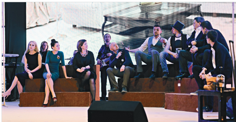
Труппа театра авантюристов в сборе.