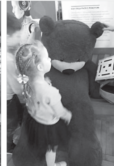
Изюминка выставки – огромный плюшевый медведь, тоже робот.

танцам дали три небольших по размеру робота. Это конструктор, который можно собрать в виде не только гуманоида, но и, к примеру, динозавра или автомобиля, а затем запрограммировать свое создание. Именно с помощью таких конструкторов и детворы развивают навыки инженерии и программирования.