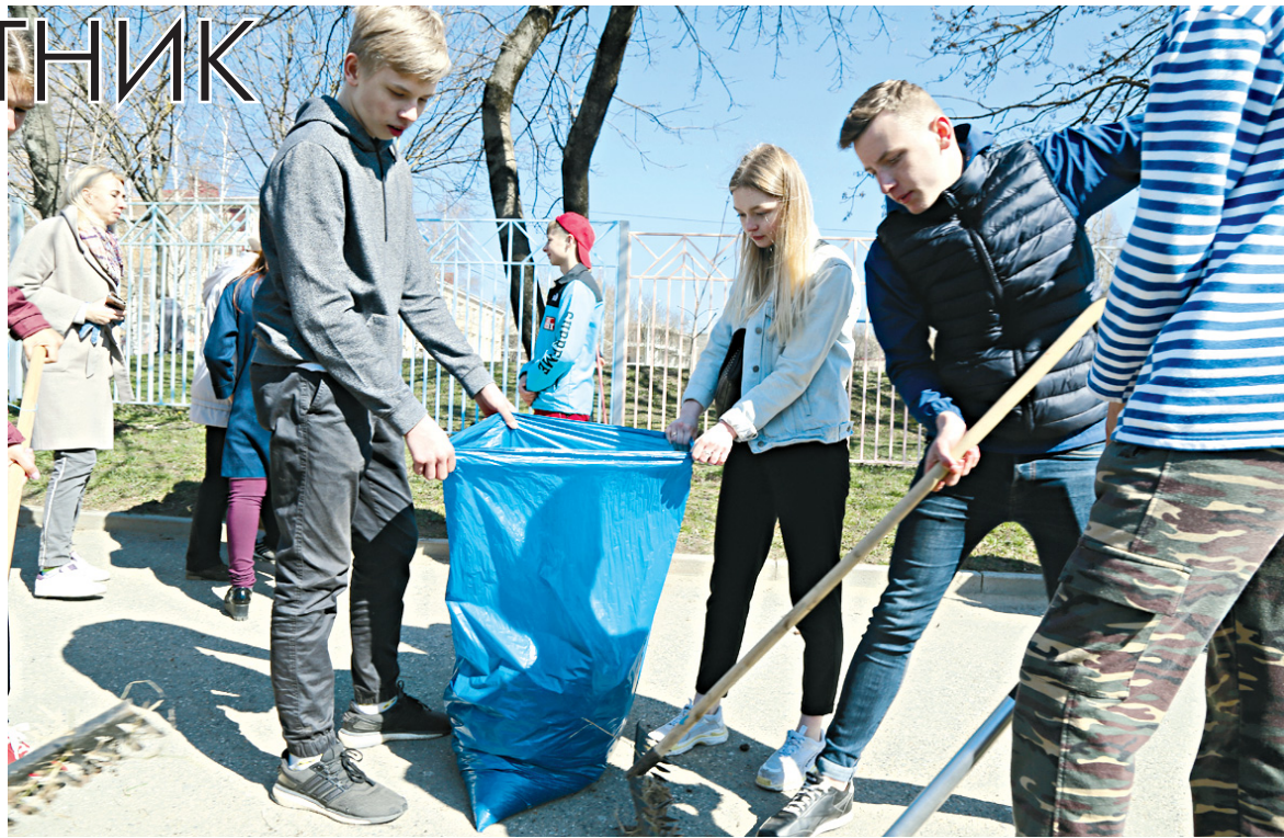
Школьники были ведущей силой в уборке города.