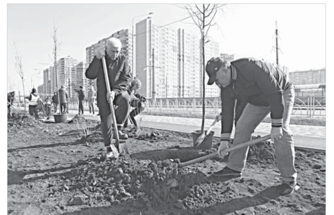
Глава города Андрей Джатдоев – постоянный участник высадки саженцев.

Стоит акцентировать внимание на том, что с 22 апреля будет ограничен въезд транспорта на территорию кладбищ. В то же время для маломобильных горожан начнет