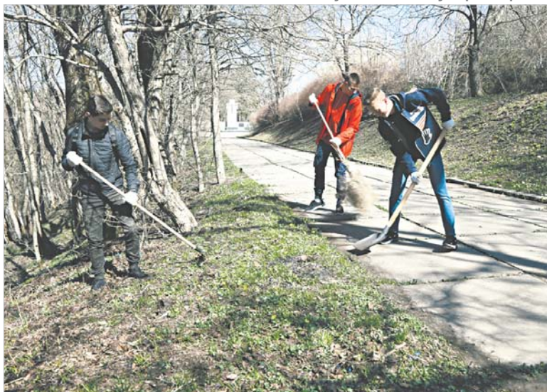
Убирали все тщательно.