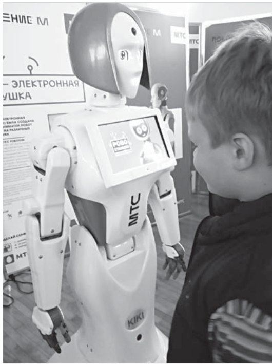
Электронная девушка-аниматор умеет проводить конкурсы и общаться на разные темы.

Теспиан, как и Кики, умеет общаться с посетителями, причем на многих языках мира, кроме этого, он умеет петь и танцевать, а рук знаменитостям он в своей жизни пожал больше, чем среднестатистический премьер-министр.