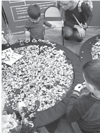
От такого количества деталей у детей разбежались глаза.

Большой популярностью на выставке пользовался Теспиан – он настоящий актер, созданный британской компанией и названный в честь древнегреческого актера. Его создали специально для постановки спектакля в механическом театре, но на самом деле, нам кажется, он способен на большее.