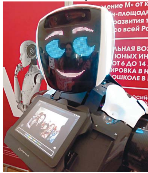
Робот-промоутер, очень дружелюбный и много знающий.