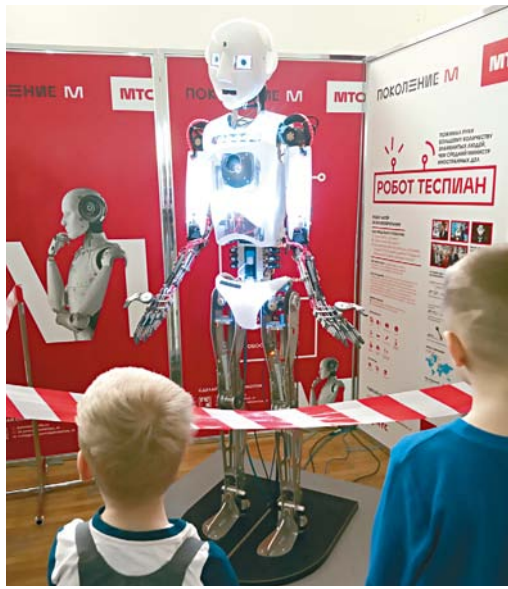
Тесприан пожал рук больше, чем среднестатистический премьер-министр.