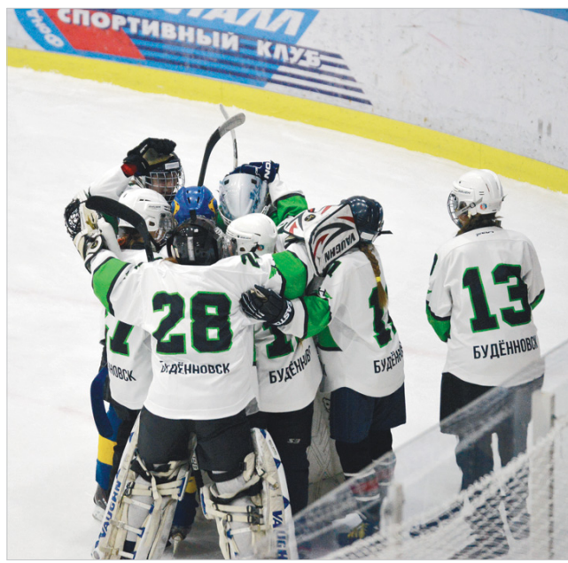
Радость первой победы.