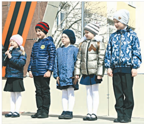
Юные ставропольцы прочли патриотические стихи для призывников.

Кстати, военкомат учитывает желания самих призывников по поводу будущей службы: хочет парень быть моряком или ракетчиком – ему помогут получить нужное направление. Но при этом надо понимать, что для каждого рода войск есть собственные ограничения, вплоть до роста и веса военнослужащих, а также показатели здоровья, морально-психологические характеристики, специальная подготовка. К примеру, 80 мальчишек, отправляющихся в армию в этом году и уже имеющих водительские удостоверения, будут проходить службу в качестве водителей.