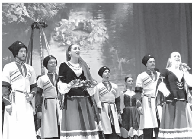
семь городов: Минск, Витебск, Бобруйск, Мозырь, Новополюцк, Пинск и легендарный Брест, жители которых в годы войны внесли весомый вклад в дело Великой Побе-

В течение недели ансамбль «Ставрополье» посетит