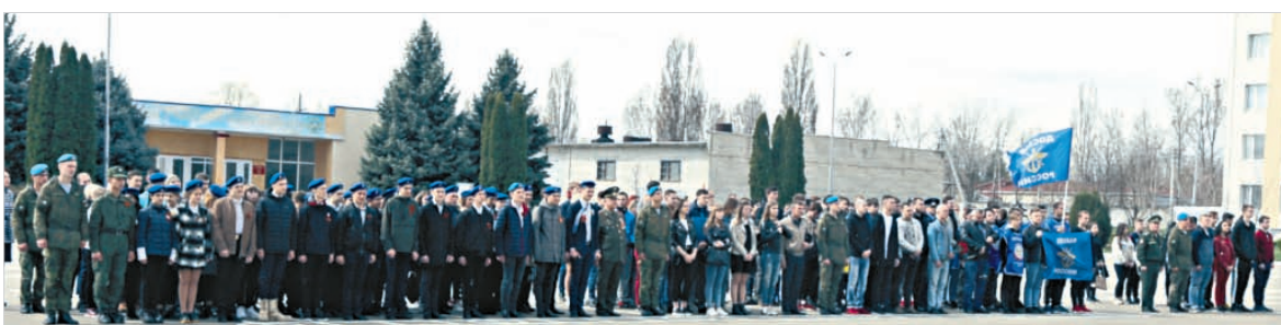
Призывники собрались на плацу 247-го десантно-штурмового гвардейского Кавказского казачьего полка.

В Ставрополе на территории 247-го десантно-штурмового гвардейского Кавказского казачьего полка состоялся традиционный День призывника.