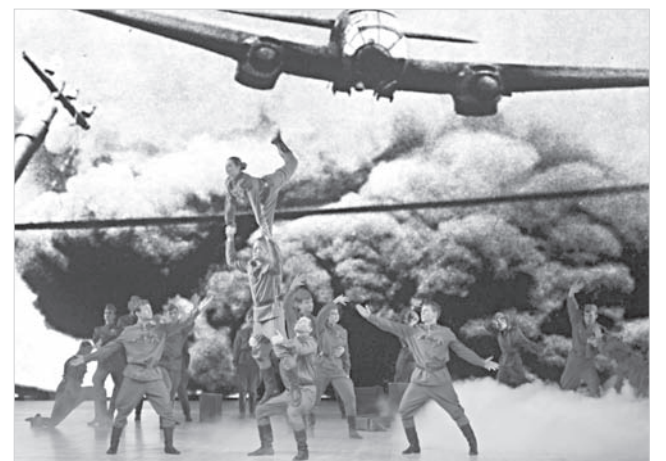
ды. В концертную программу включены композиции военных лет, а также лучшие вокальные и хореографические номера из золотого фонда ансамбля.