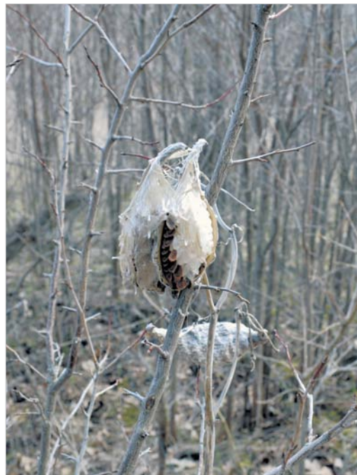
Прошлогодние плоды ваточника сирийского.