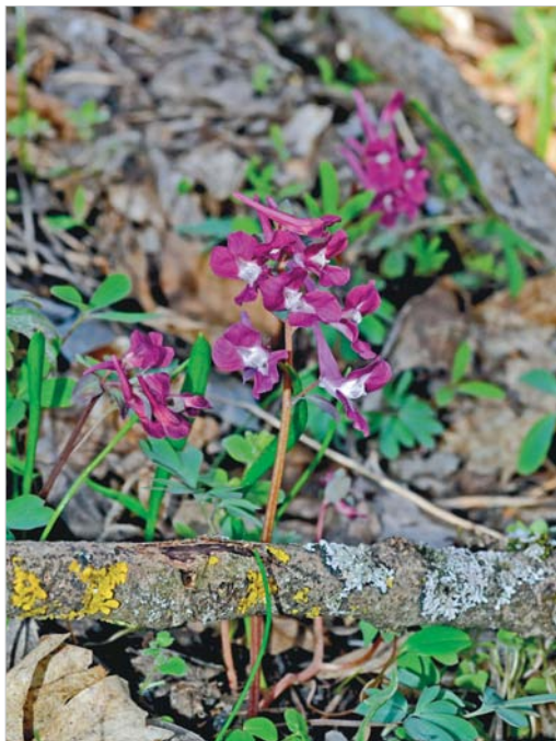
Хохлатка кавказская. Красная книга Ставропольского края.