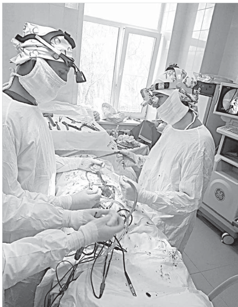
Идет операция по укреплению металлоконструкции на позвоночнике.