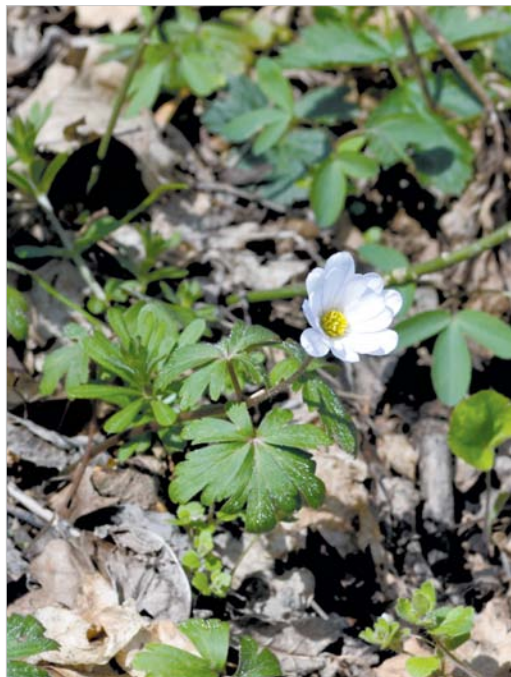
Ветреница нежная. Красная книга Ставропольского края.