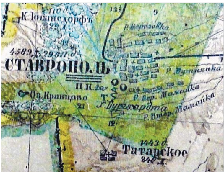
Хутор Бургхардта на карте Ставропольской губернии 1896 года.