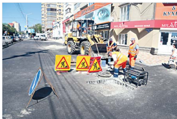
А здесь – работы еще продолжаются.