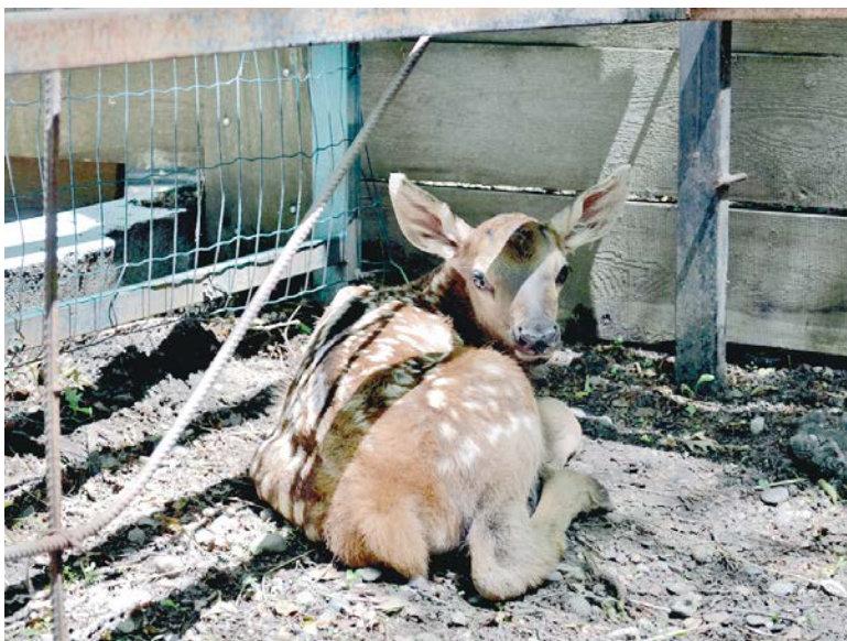
Олененок в ставропольском зоопарке.

В ставропольском зоопарке снова пополнение. Ставший уже приятной традицией беби-бум подарил нашему городу пять новых зверушек: одного олененка и четверых страусят эму.