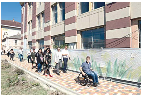
Вниз по Лермонтова – новенький тротуар.

Лариса РАКИТЯНСКАЯ.