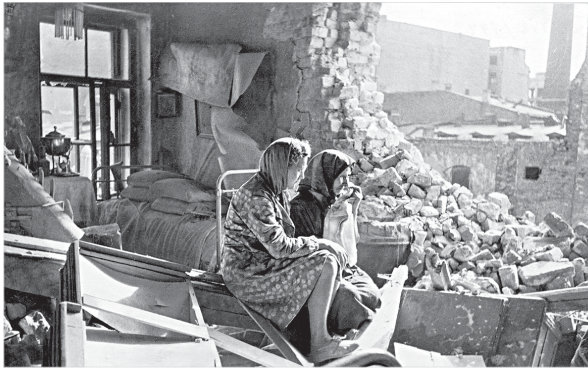
Жители осажденного города.