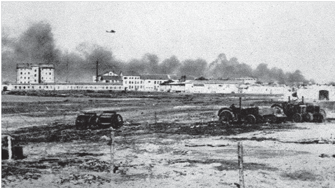
Бомбежка Керчи в 1941 году.