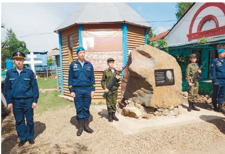
В карауле у мемориала.