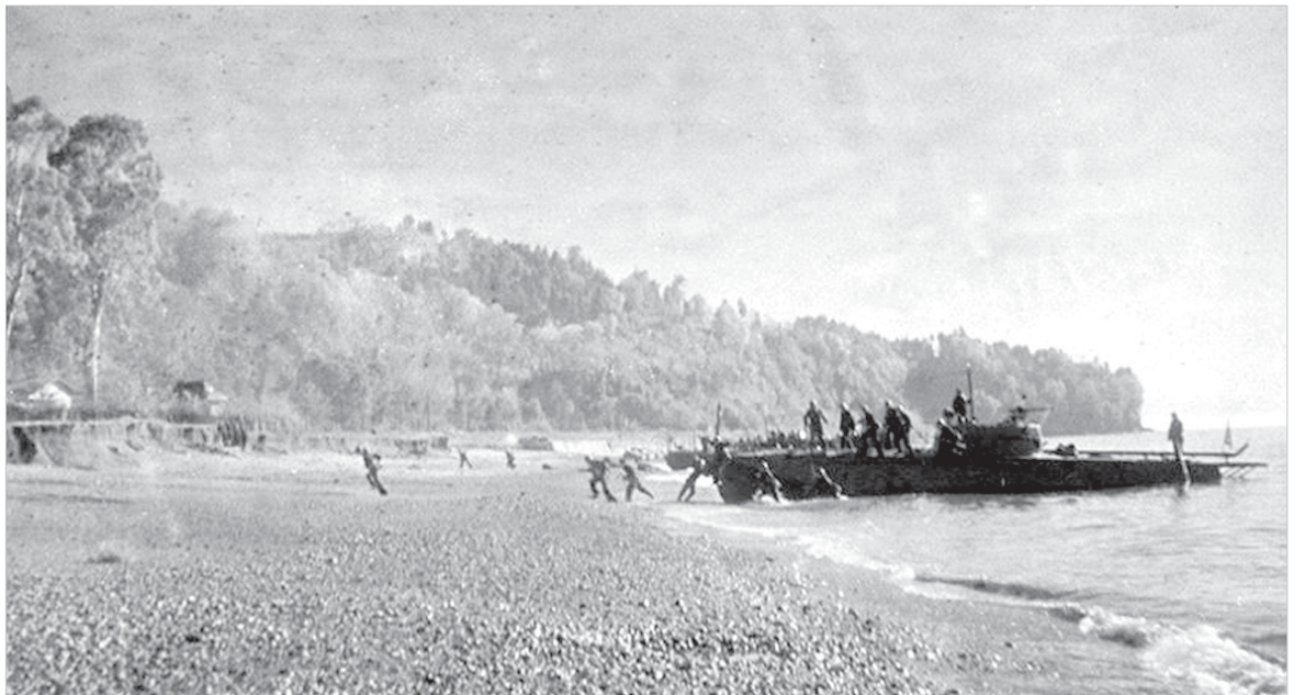
Керченский десант 1941 года. https://nstarikov.ru/wp-content/uploads