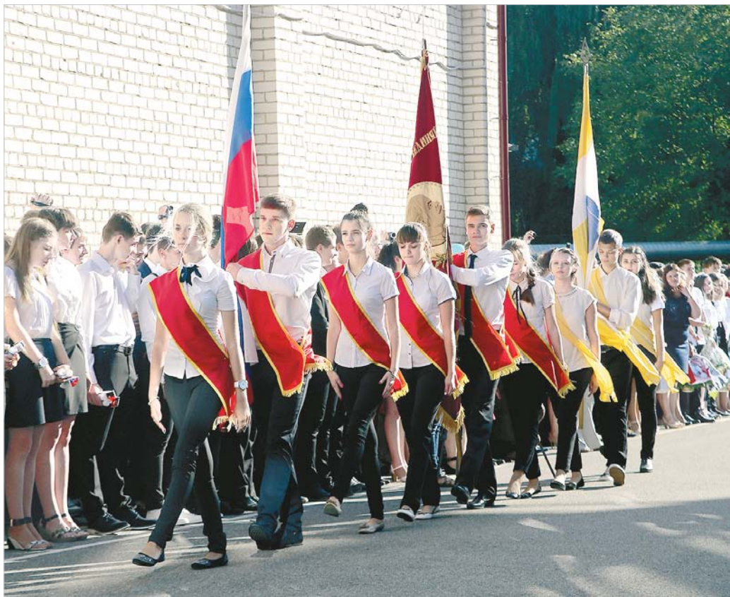
Традиционная торжественная линейка. Совсем скоро прозвенит последний звонок.

Государственная итоговая аттестация для выпускников 9-х классов пройдет в основной период с 24 мая по 2 июля. Последний звонок для них — еще и сигнал к «низкому старту» - уже завтра.