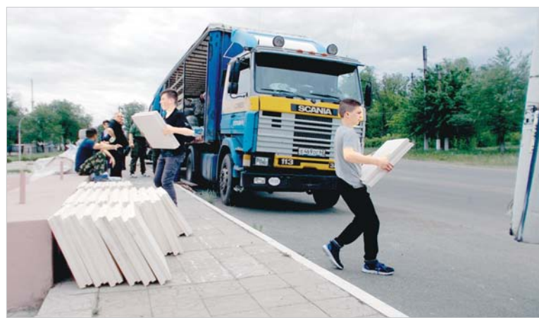
Теперь и ремонт интерната пойдет веселее.

Политика выдавливания актуальна до сих пор