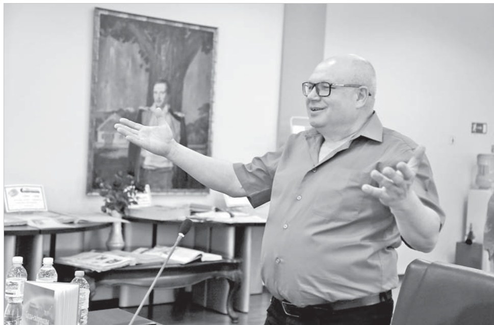
Стихи читает автор.

хов. Первые два вышли под тем же названием.