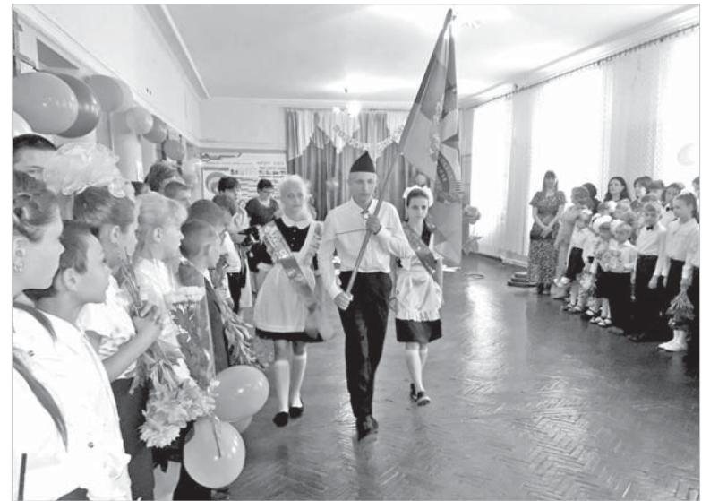
Последний звонок. Первый военный выпуск. Вынос знамени республики.