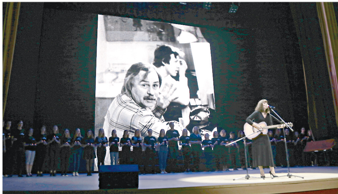
Памяти Учителя посвящается.