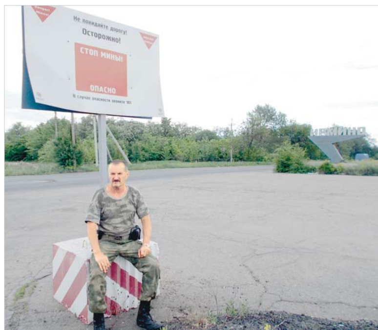
Рядом с городом начинается «серая зона».

«Не покидайте дорогу. Осторожно. СТОП МИНЫ! Опасно». Эта табличка установлена прямо напротив въезда в маленький шахтерский городок Ирмино, который вот уже пять лет вместе с Первомайском, Калиново, Молодежным, Марьевкой находится на линии соприкосновения. К табличкам-предупреждениям возле так называемой «серой зоны» жители уже привыкли. Но вот к данности, что мины могут оказаться вне этой самой зоны или «прилететь» с сопредельной территории, привыкнуть сложно.