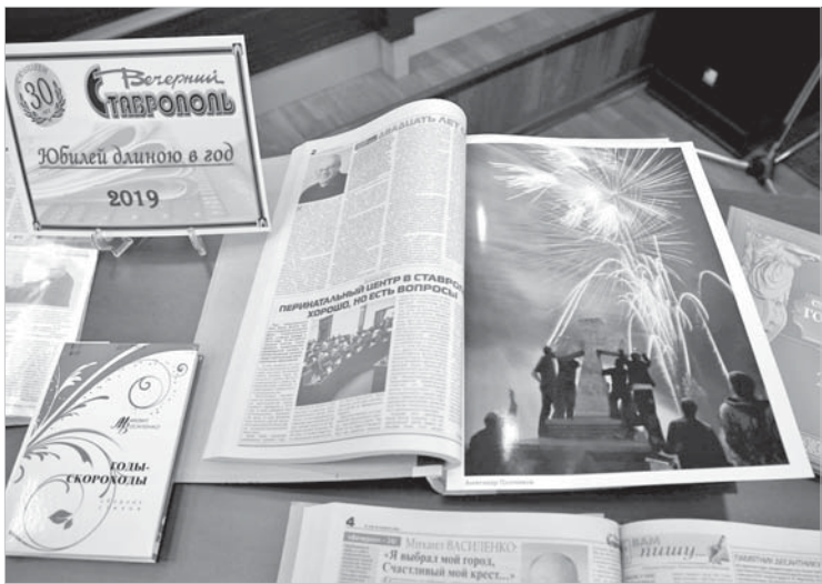
Сотрудники библиотеки подготовили выставку, посвященную 30-летию газеты «Вечерний Ставрополь».