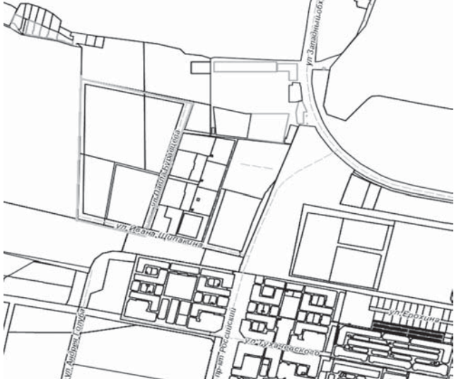
СХЕМА подготовки изменений в документацию по планировке территории (проект планировки территории, проект межевания территории) в целях устойчивого развития территории, комплексной застройки города Ставрополя западнее проспекта Российского, утвержденную постановлением администрации города Ставрополя от 19.03.2018 № 457 «Об утверждении документации по планировке территории (проекта планировки территории, проекта межевания территории) в целях устойчивого развития территории, комплексной застройки города Ставрополя западнее проспекта Российского»

Описание границ территории подготовки изменений в документацию по планировке территории (проект планировки территории, проект межевания территории) в целях устойчивого развития территории, комплексной застройки города Ставрополя западнее проспекта Российского, утвержденную постановлением администрации города Ставрополя от 19.03.2018 № 457 «Об утверждении документации по планировке территории (проекта планировки территории, проекта межевания территории) в целях устойчивого развития территории, комплексной застройки города Ставрополя западнее проспекта Российского», в границах земельного участка с кадастровым номером 26:12:011401:300, расположенного по адресу: Российская Федерация, Ставропольский край, город Ставрополь, улица Западный обход, 60.