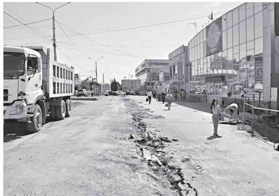
Пространство перед Верхним рынком скоро преобразится.