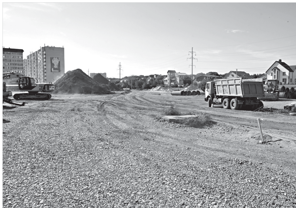
Реконструкция улицы Пирогова идет полным ходом.