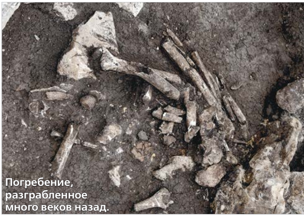
Погребение, разграбленное много веков назад.