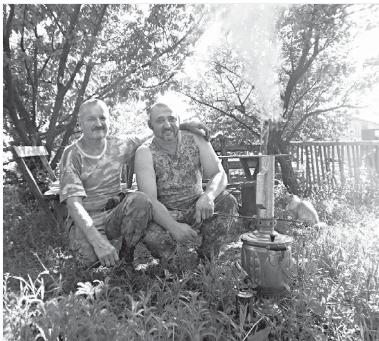
Справа «Леон» – человек, увидевший Бога.