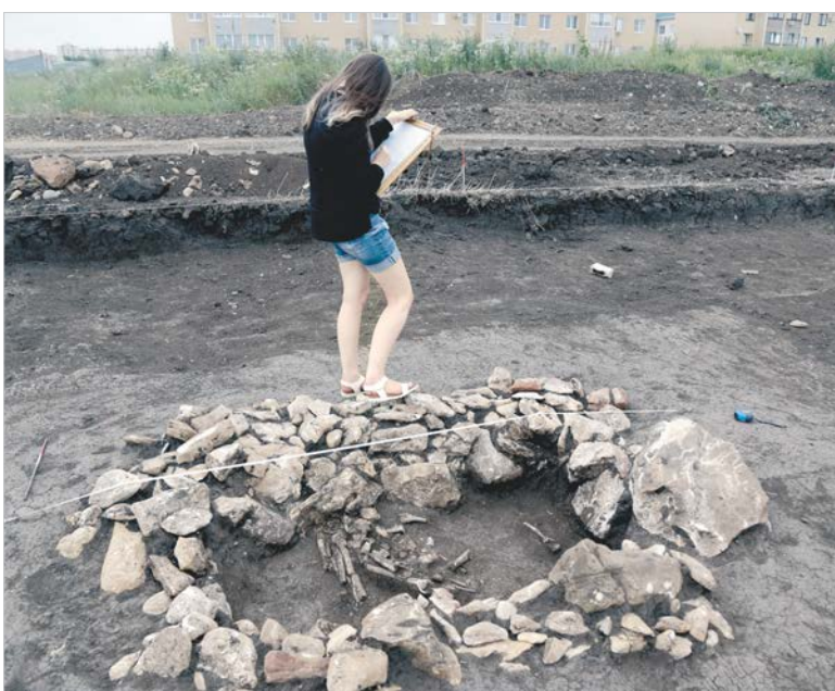
Каждый археолог должен быть хоть немного художником.