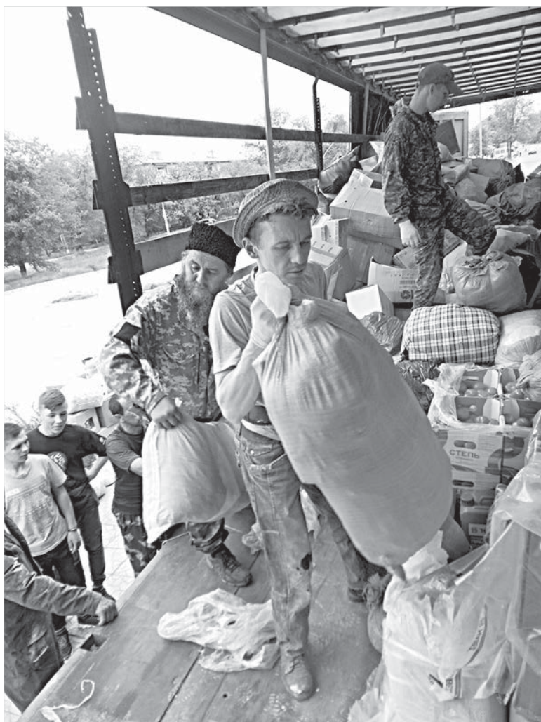
Для разгрузки нужна мужская сила.