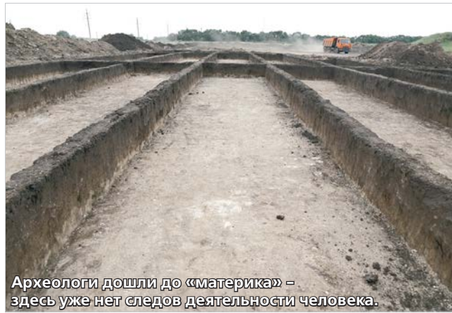
Археологи дошли до «материка» - здесь уже нет следов деятельности человека.