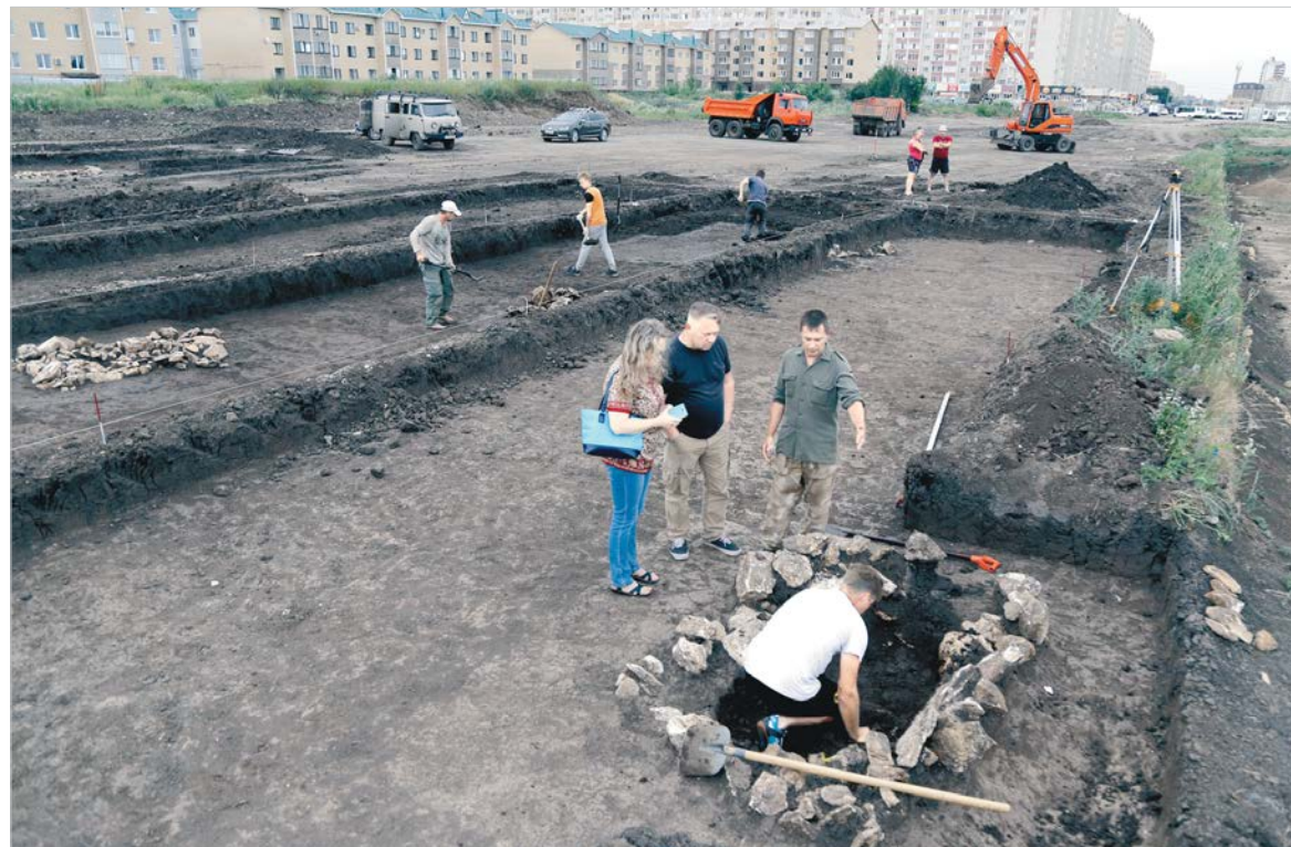
Задача - убрать из зоны строительства археологические объекты.