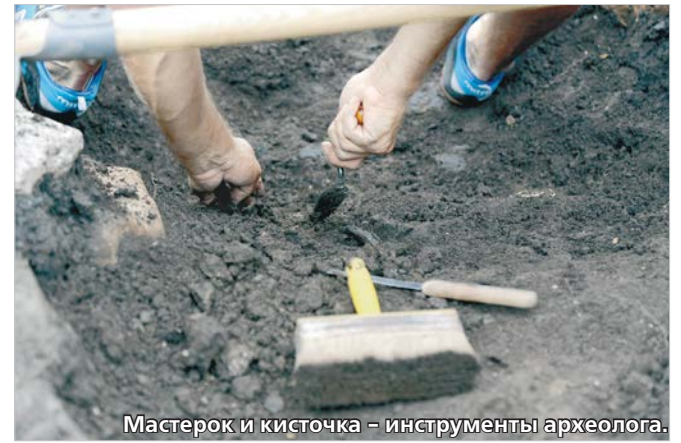
Мастерок и кисточка - инструменты археолога.