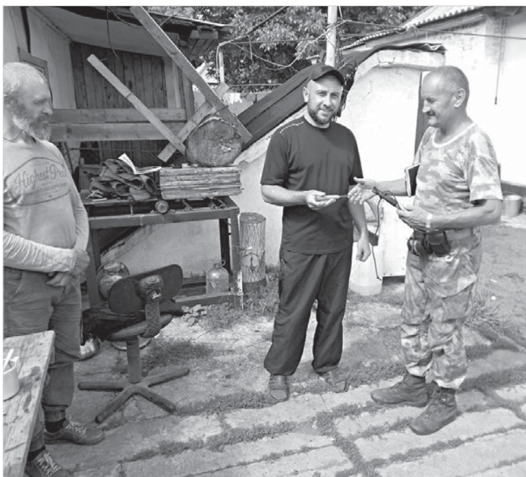
Лихой комбат «Терек» (слева) теперь занимается совершенно мирным делом.