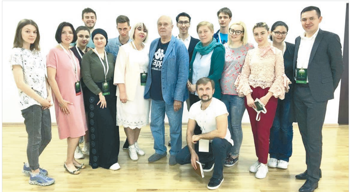
Владимир Меньшов в окружении зрителей на кинофестивале «Герой и Время» в Железноводске.