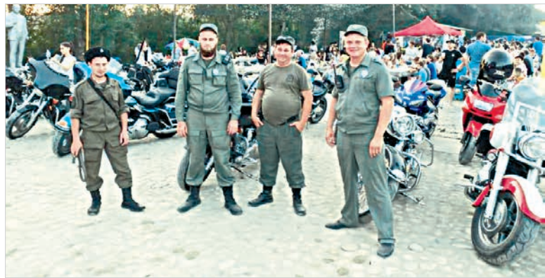
В байкерском лагерелюдно.

Само мероприятие состоялось на городском озере, но прежде чем туда отправиться, байкеры, по традиции, совершили торжественный выезд города. От площади Ленина