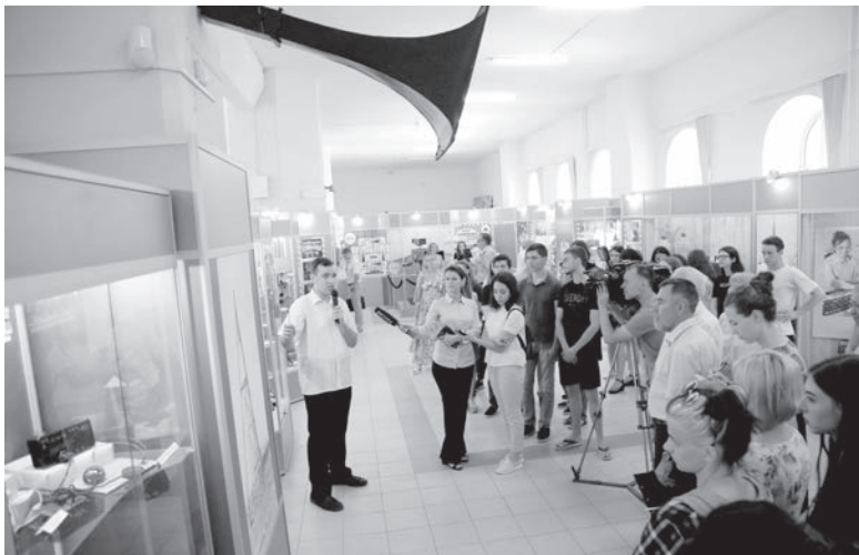
На открытии выставки — студенты - будущие журналисты, бывшие сотрудники СГТРК...