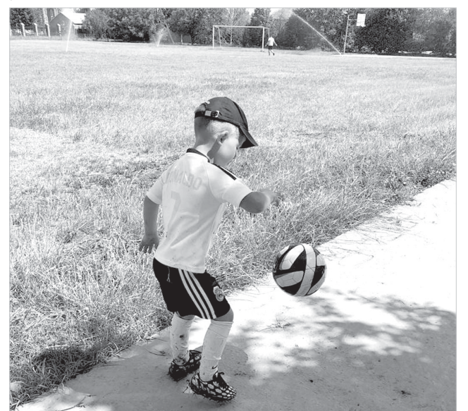
И в каникулы стадион не пустует.

Этот проект реализуется в рамках программы поддержки местных инициатив.