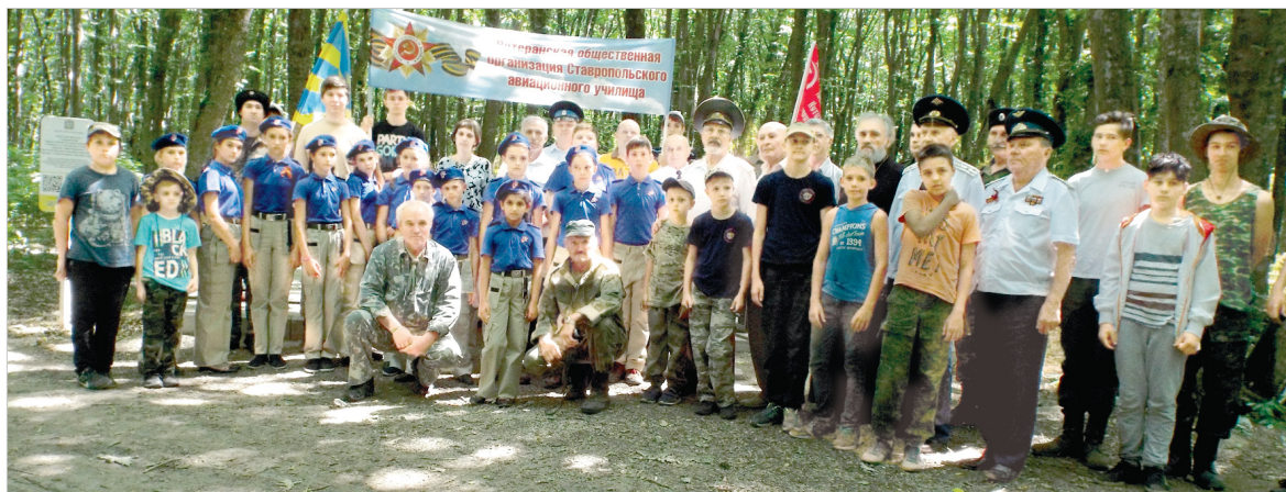
Участники Вахты памяти.