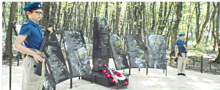
Открытие Вахты памяти проходило на окраине Русского леса, где в период оккупации Ставрополя проводились массовые расстрелы.