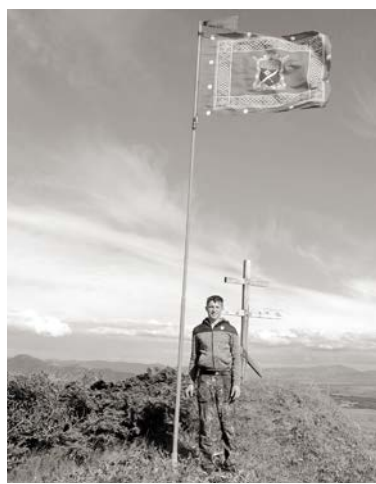
Флаг ТВКО над Камчаткой.