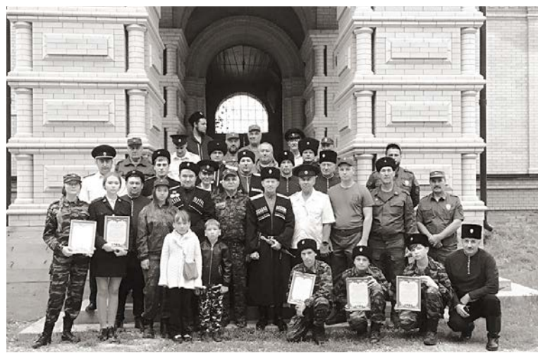
Казаки у возрождающегося храма.

Справка: в 1777 году на правом берегу реки Куры светлейшим князем Григорием Потёмкиным-Таврическим была заложена одна из крепостей Азово-Моздокской линии. Её нарекли Павловской, в честь святого апостола Павла. Впоследствии здесь образовались две станицы – Старопавловская и Новопавловская (ныне город Новопавловск). Построенный казаками храм освятили во имя Святых апостолов Петра и Павла. К сожалению, величественный храм постигла трагическая участь. Как и многие православные святыни, он был взорван в 1937 году. В настоящее время идет восстановление храма и возвращение ему первоначального исторического облика.