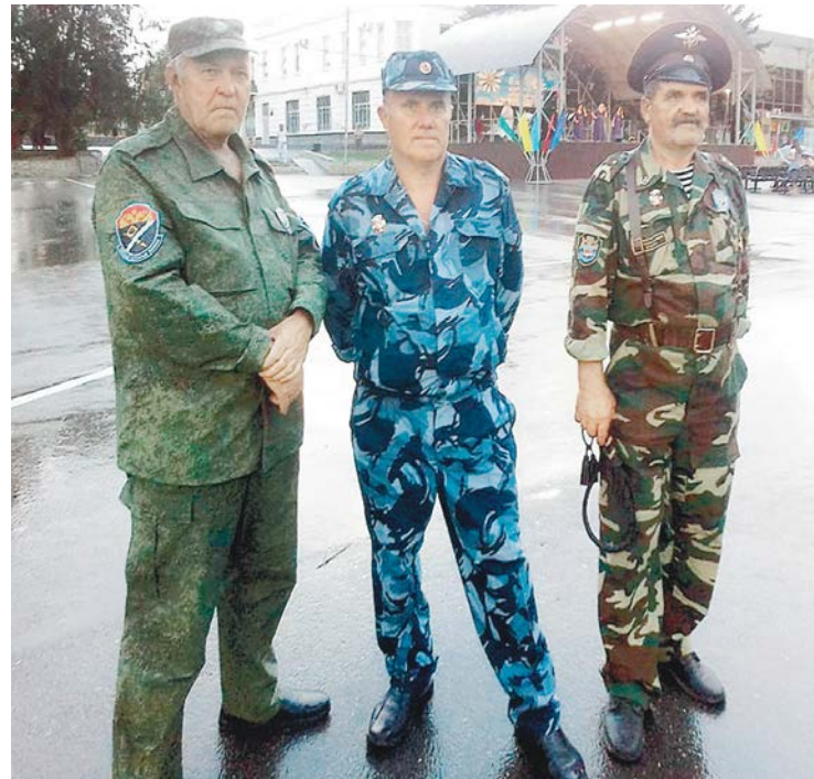
Казачий наряд на патрулировании.

Еще казаки принимают участие в обеспечении экологической и пожарной безопасности. Так, казачье общество села Татарка совместно с инспекторами Росрыболовства патрулируют русло реки Егорлык, охраняя краснокнижных рыб от браконьеров. Сегодня на Ставрополье действуют шесть пожарных казачьих частей общей численностью 72 человека.