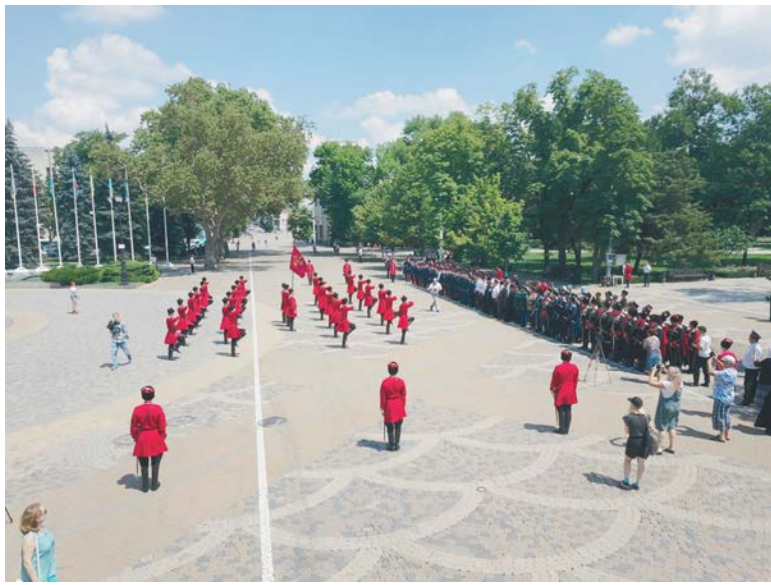
Развод казачьего подразделения.

Так, в делегацию Терского войска вошли 32 человека. Из них 22