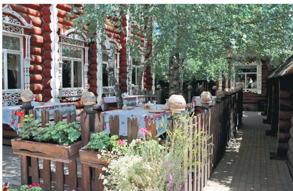
Летняя площадка кафе «Изда»: в таком месте приятно и перекусить, и отдохнуть на свежем воздухе.

— В наших планах — модернизация всей выездной торговли. Спасибо фермерским