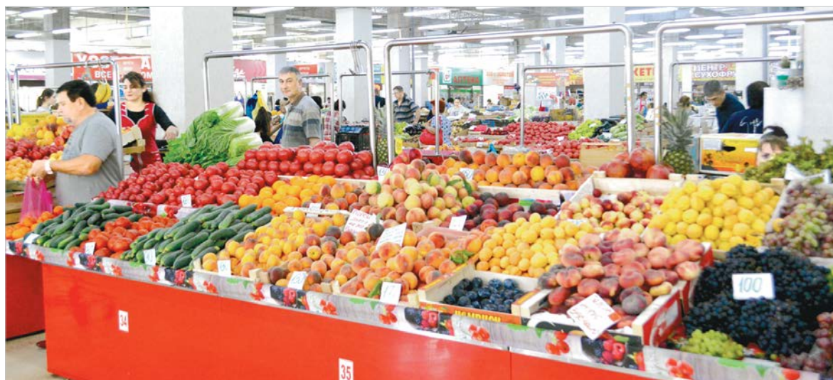
«Городской рынок» на ул. Тухачевского: свежие фрукты и овощи на площади около 4 тысяч квадратных метров.

На «Городском рынке» по улице Тухачевского, например, под одной крышей прекрасно сочетаются два направления — и традиционного сельскохозяйственного рынка, и стационарной торговли. На первом этаже здесь расположены торговые ряды с овощами