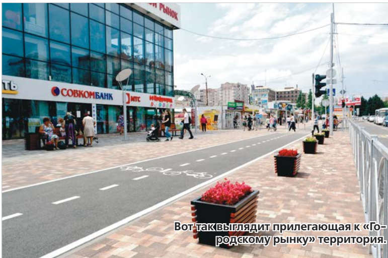
Вот так выглядит прилегающая к «Городскому рынку» территория.

№ 140 (6752) • 27 ИЮЛЯ • СУББОТА • 2019 ГОД WWW.VECHORKA.RU