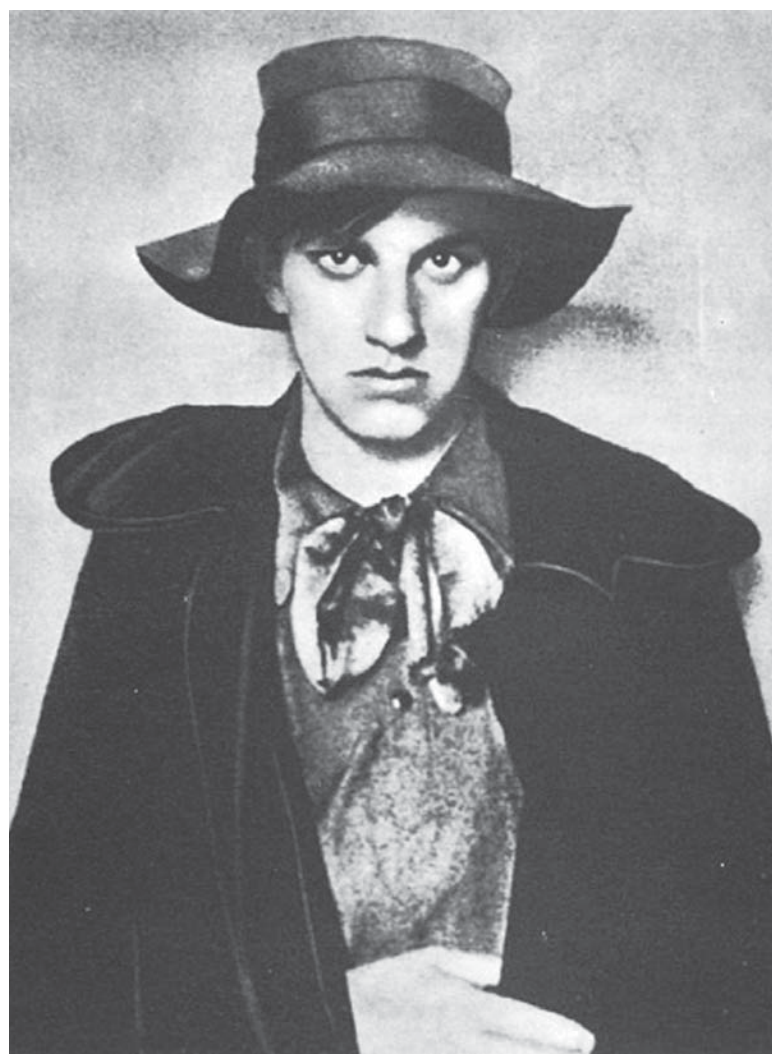
Владимир Маяковский в 1910 г. (www.istorya.ru).