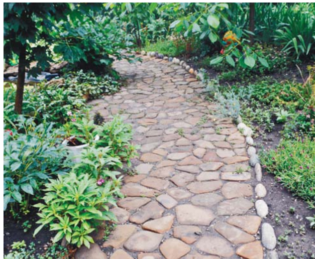
Рукотворная дорожка из природного материала.