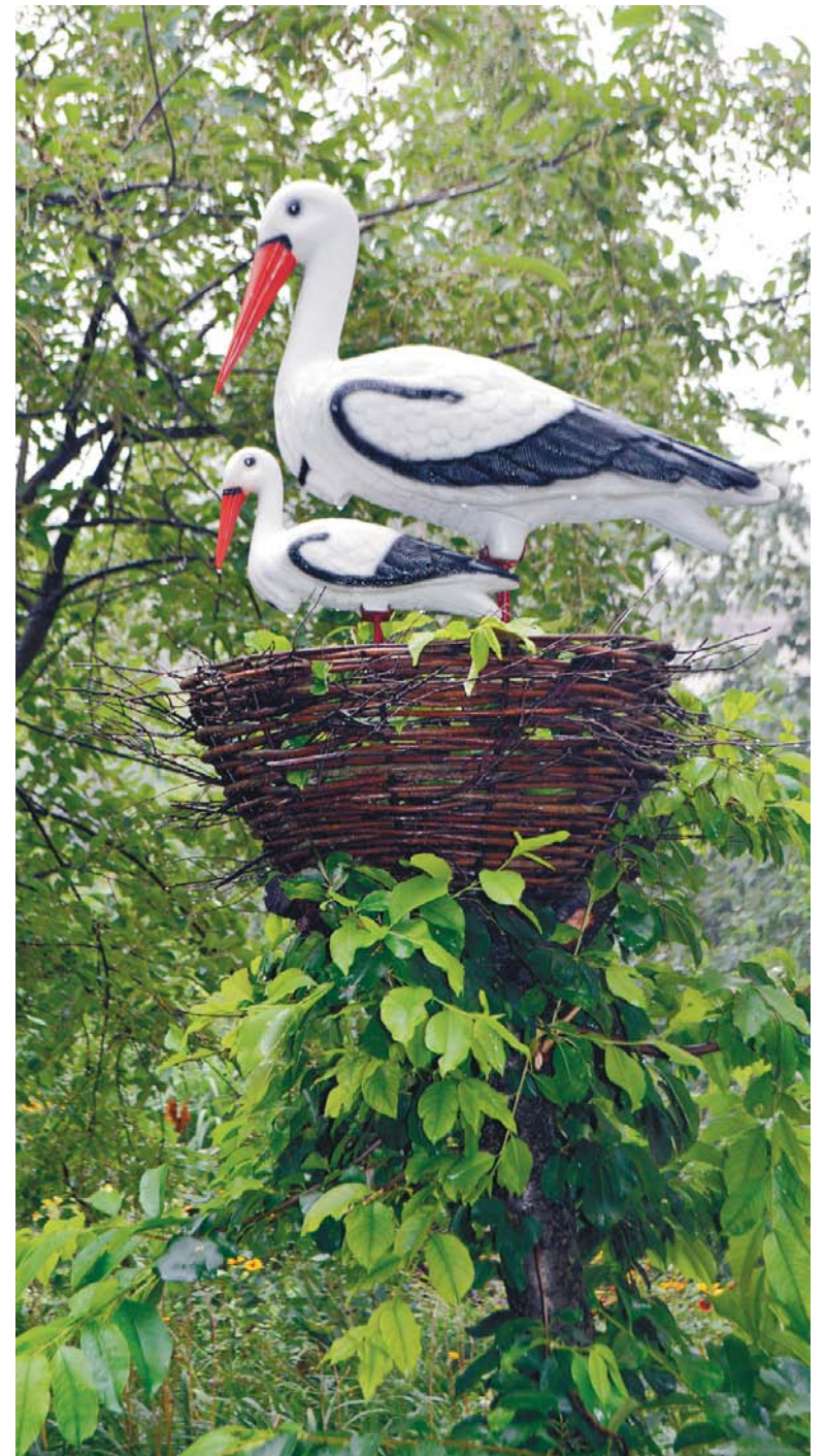
Семья аистов – на счастье.