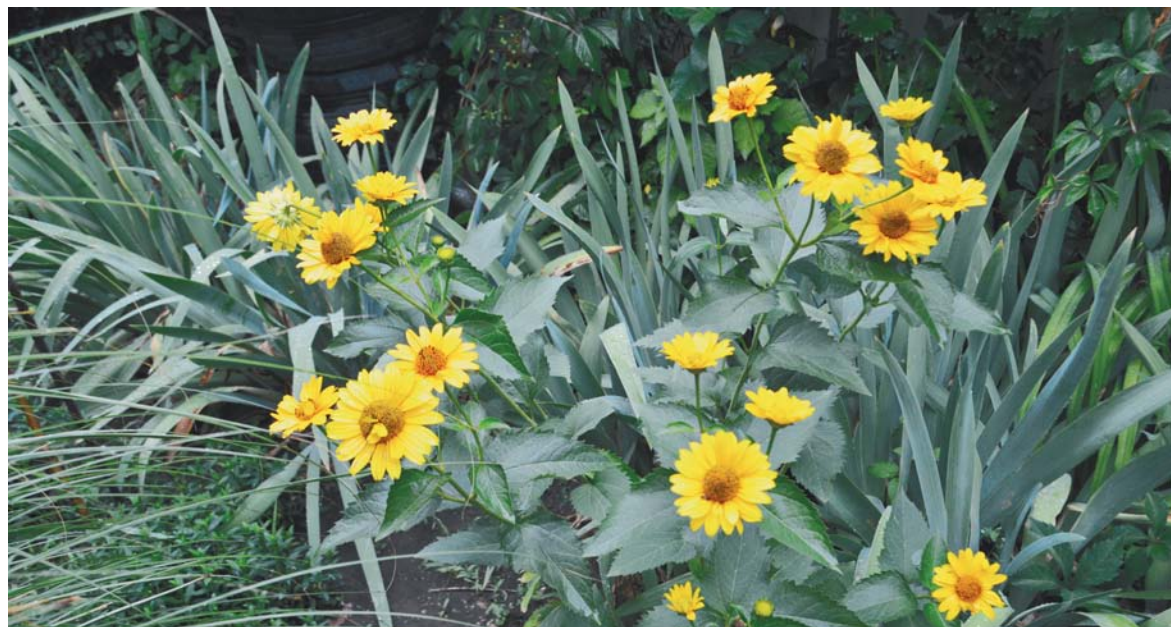
Пока другие цветы отдыхают, сад украшает солнечная рудбекия.