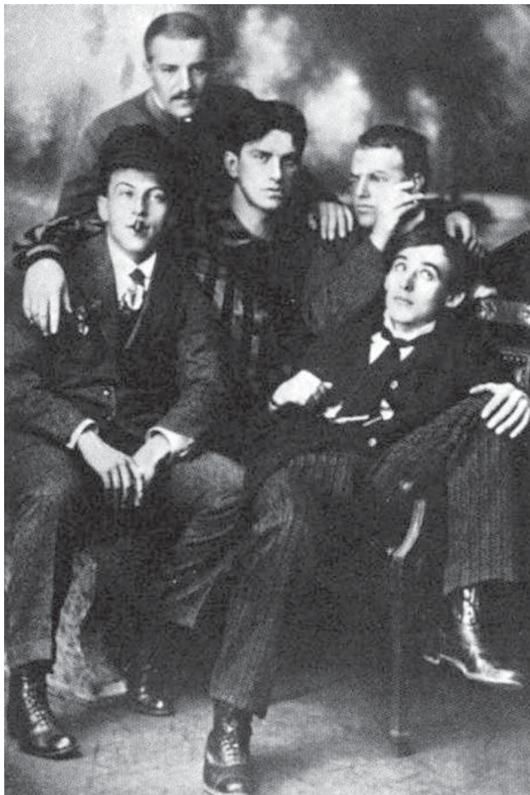
Василий Каменский, Владимир Маяковский, Велимир Хлебников и братья Давид и Николай Бурлюки.