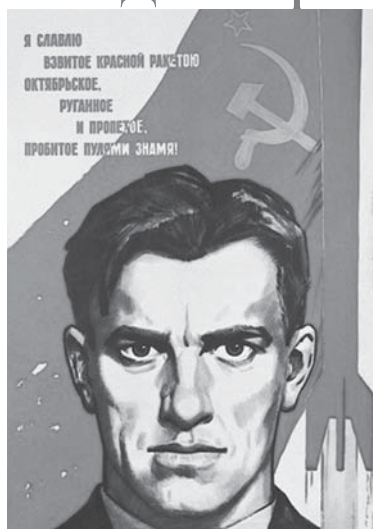
Пробитое пулями знамя!.

Маяковский входил в группу поэтов, которые называли себя футуристами. Это движение возникло позже всех остальных объединений «серебряного века», то есть позже акмеистов и символистов. Футуризм (футурум – будущее) – общее название художественных авангардистских движений первой четверти XX века. В литературе футуристов интересовало не столько содержание, сколько форма стихосложения: они придумывали новые слова, использовали вульгарную лексику, профессиональный жаргон, язык документа, плаката и афиш. Предпосылкой появления русского футуризма стал документ «Обоснование и манифест футуризма», опубликованный в 1909 году итальянским поэтом Филиппо Томмазо Маринетти. Маяковский и круг его друзей не столько следовали правилам этого манифеста, сколько заразились идеей создания новой формы искусства. В первую очередь, они считали, что искусство должно искать новые средства выражения, что новые чувства нового человека в новую эпоху изменяющегося мира, когда все прежние формы жизни рушатся, невозможно передать старыми художественными средствами. В силу этого члены литературной группировки «Гилея», в первую очередь, Давид Бурлюк, Владимир Маяковский, Василий Каменский, Алексей Крученых и Велимир Хлебников, опубликовали свой манифест «Пощечина общественному вкусу». Документов ни с таким названием, ни тем более с такими идеями до сих пор попросту не существовало. Под общественным вкусом круг друзей Маяковского понимал мещанский образ