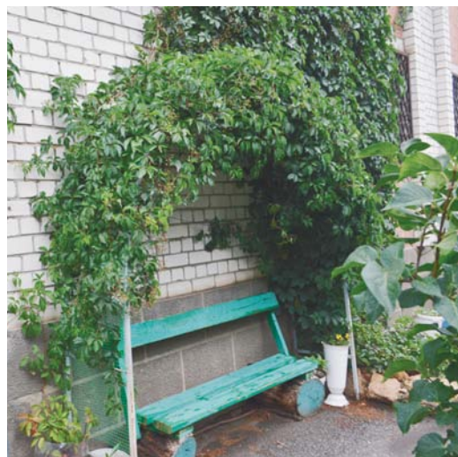
Тенистые уголки отдыха.