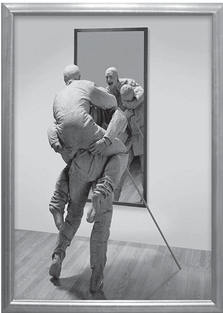
Владимир Маяковский и Велимир Хлебников (www.ka2.ru).

«... Засадил садик мило, дочка, дачка, вода и гладь – сама садик я садила, сама буду поливать. «... Неважная честь, чтоб из этаких роз мои изваяния высились по скверам, где харкает туберкулез, где б... с хулиганом да сифилис. «...»