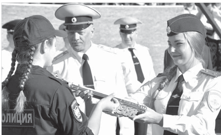
Символический ключ знаний передан первокурсникам.