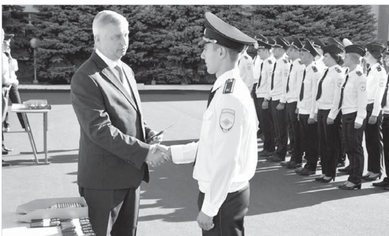
Вручение первых офицерских погон.