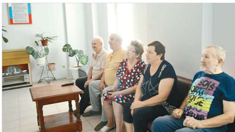
В комнате отдыха у телевизора.

– Изменился сам подход к возрастным пациентам. Помимо лечения так называемых возраст-ассоциированных заболеваний сейчас делается акцент на выявление гериатрических синдромов, на которые раньше не обращали внимания. Да и сами больные считали их обычными спутниками старения. При госпитализации пациентов мы проводим тестирование. Интересуемся, снизился ли у них вес, ухудшились ли память, зрение, слух, подвижность. Изучаем, насколько они подвижны и есть ли у пациента угроза падения. Бывает ли у них депрессия. И, в отличие от других отделений, мы заполняем на больного два медицинских документа: врач – историю болезни, а медсестра – карту сестринского осмотра. А при выписке выдаем заключение врача-гериатра с индивидуальным планом профилактических,