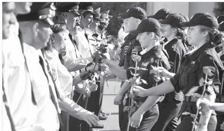
В день знаний все цветы – преподавателям.

Начальник филиала напомнил, что 3 сентября в России объявлен Днём солидарности в борьбе с терроризмом. Эта памятная дата связана с трагическими событиями в Беслане, когда боевики за-