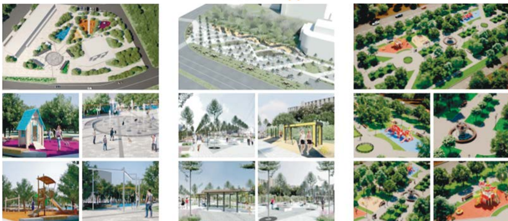
Сквер по улице Ленина