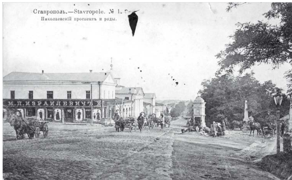
Открытка с видом Николаевского проспекта, слева – торговые ряды. Начало XX века. Из фондов Государственного архива Ставропольского края.