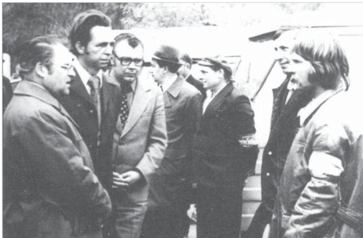
Инструктаж добровольной народной дружины.