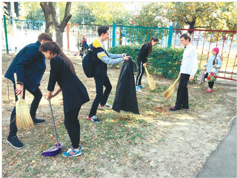
Акция по благоустройству школьной территории.

СПРАВКА. Всероссийский конкурс в области педагогики, воспитания и работы с детьми и молодежью до 20 лет «За нравственный подвиг учителя» проводится с 2006 года Синодальным отделом религиозного образования и катехизации совместно с Министерством просвещения РФ при поддержке аппарата полномочного представителя Президента в федеральных округах. За последние 10 лет в конкурсе приняли участие свыше 15 тысяч российских педагогов.