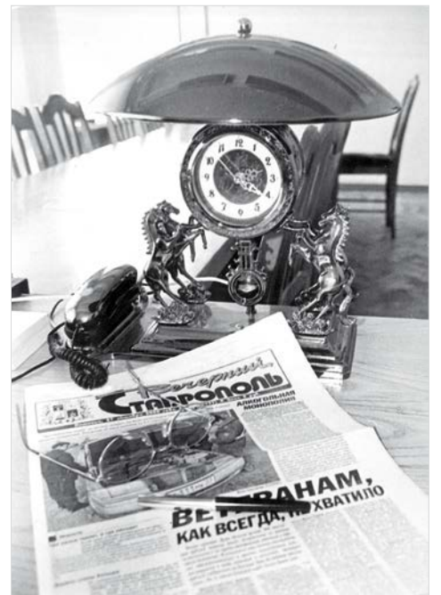
Редакционный «натюрморт» 1999 года.