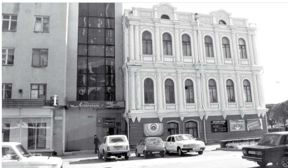
В 1996 году в это здание на улице Булкина, 8, переехала «Вечерка».