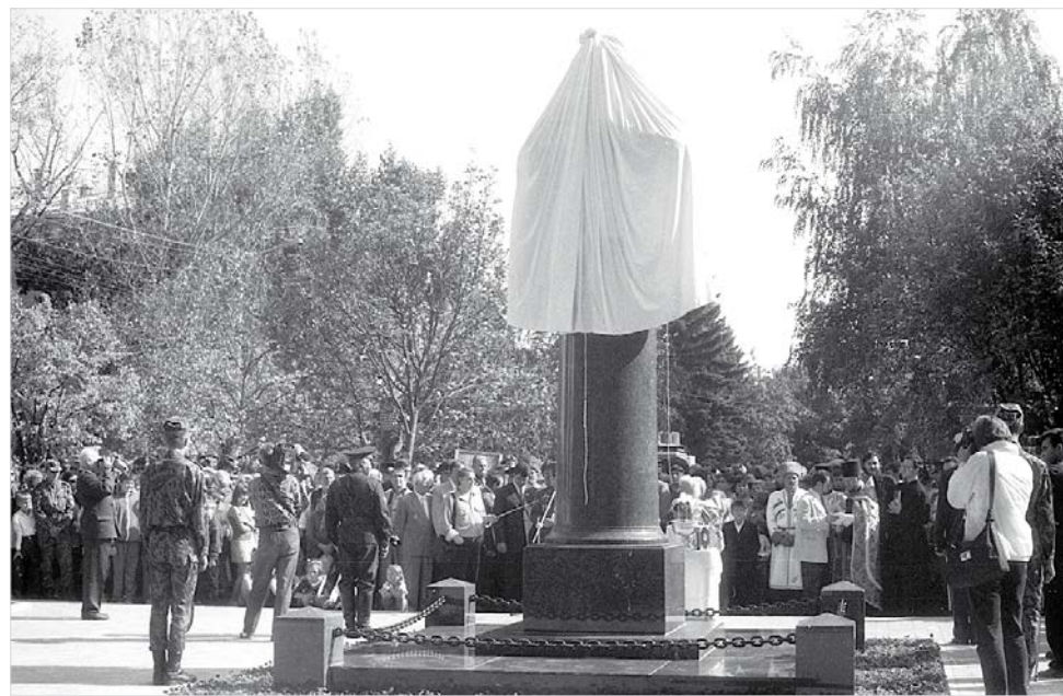
В День города – 1998 на Ермоловском бульваре был открыт бюст генерала А.П. Ермолова.