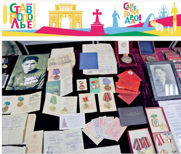
На выставке архивисты представили лишь часть принятых документов.