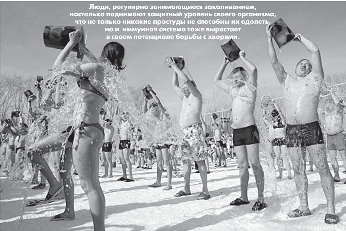
Люди, регулярно занимающиеся закаливанием, настолько поднимают защитный уровень своего организма, что не только никакие простуды не способны их одолеть, но и иммунная система тоже вырастает в своем потенциале борьбы с хворями.

Хотелось бы еще раз обратиться к теме здоровья, ибо это насущная проблема многих миллионов людей, но обратимся к ней, как к некоей способности сродни предрасположенности к музыке, рисованию или стихосложению. Мы просто никогда не задумывались над постановкой вопроса в подобном ракурсе, полагая, что здоровье – это дар Свыше, который либо есть, либо его нет. Да, это и на самом деле такой же дар, как способность стать пианистом или художником. По сути, это наше право. Но любой дар, не подкрепленный большим трудом, становится нереализованным правом или упущенным шансом, как принято говорить по этому поводу.