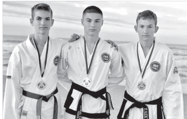
Сборная команда Ставропольского края – победитель Игр боевых искусств 2019 года.