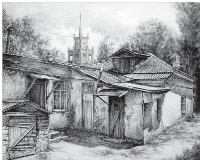
Надежда Перехода. «Старый город. Проспект Октябрьской революции».