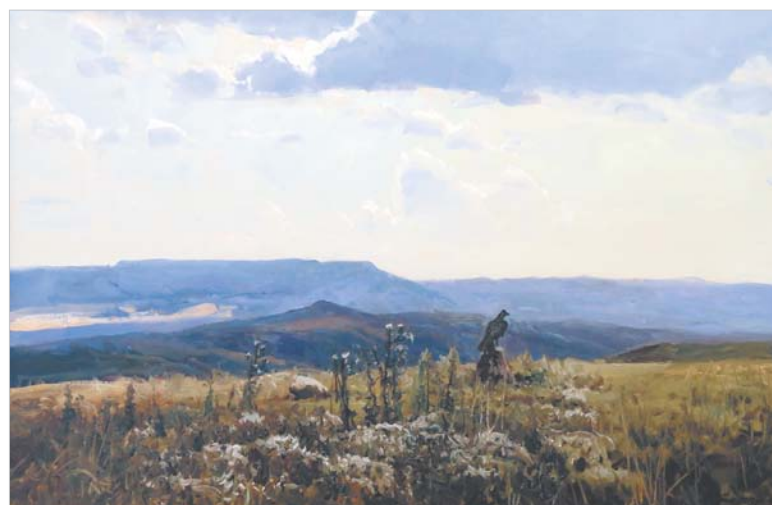
Александр Бабич. «Холмы Ставрополя».

Ольга МЕТЕЛКИНА.