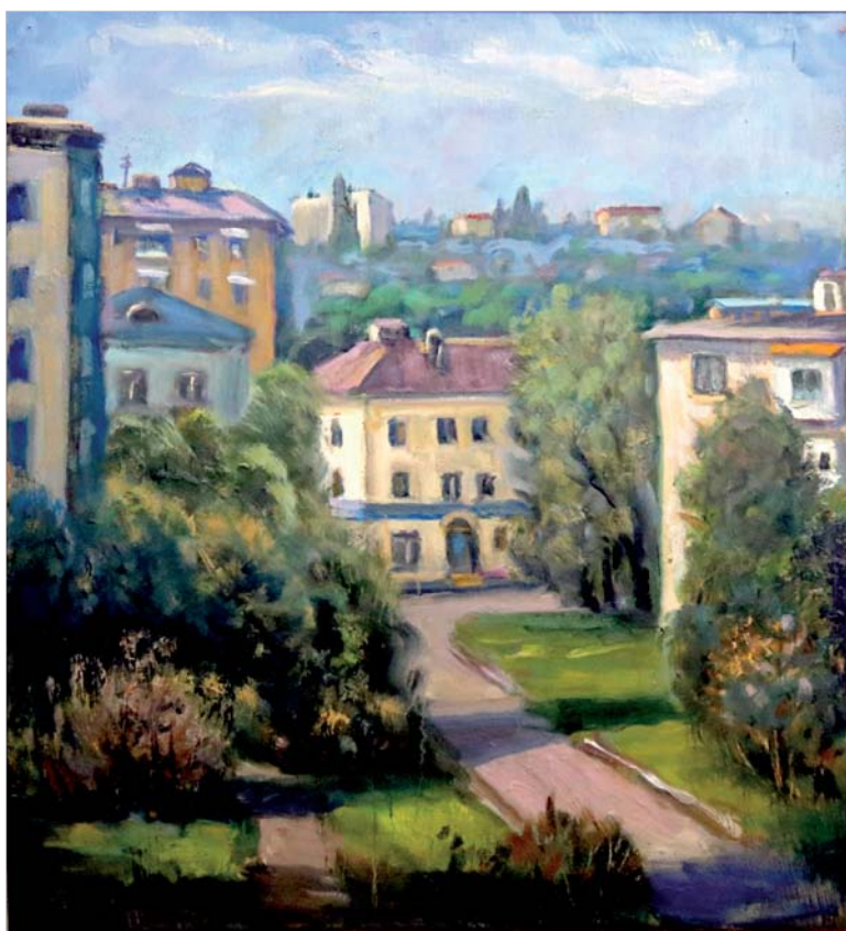
Владимир Шегедин. «Ставрополь. На улице Добролюбова».

«Ставропольские просторы» Василия Молокова тоже создавались с летним настроением. Характерный для нашего края