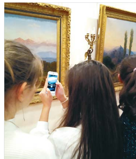
Школьники изучают возможности приложения «Artefact».