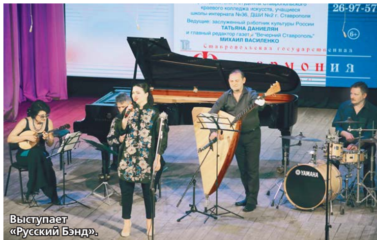
Выступает «Русский Бэнд».