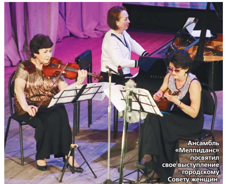
Ансамбль «Мелпиданс» посвятил свое выступление городскому Совету женщин.