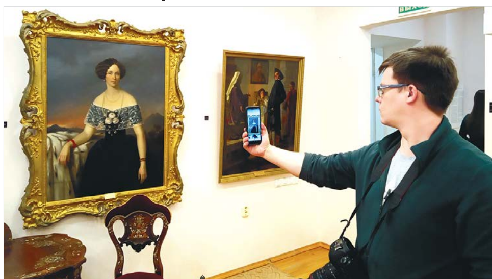
Проект «Artefact» в «Золотой коллекции» музея.