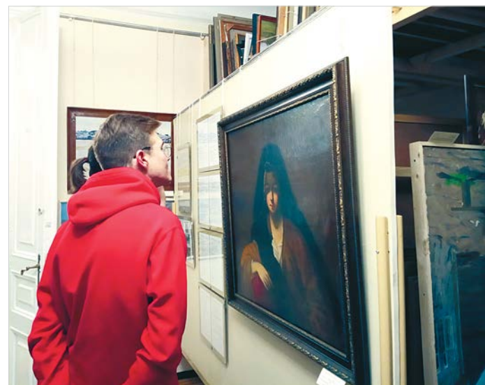
В зоне открытого показа фондов музея.