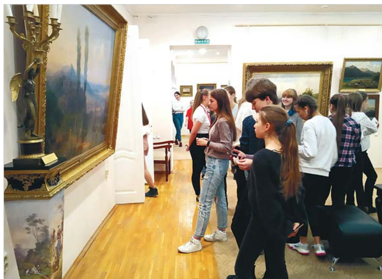
В залах Ставропольского музея изобразительных искусств аншлаги.