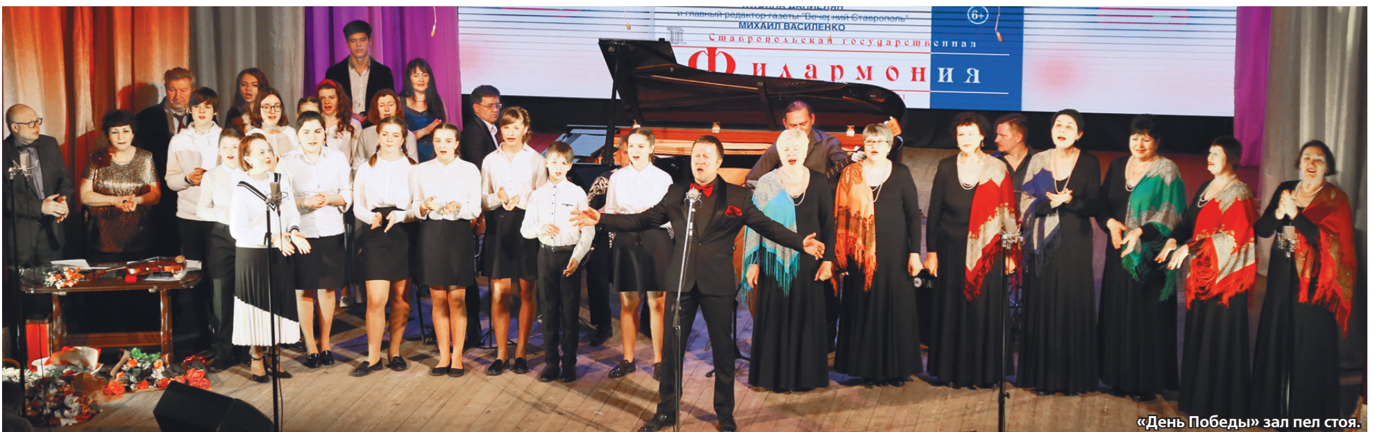
«День Победы» зал пел стоя.