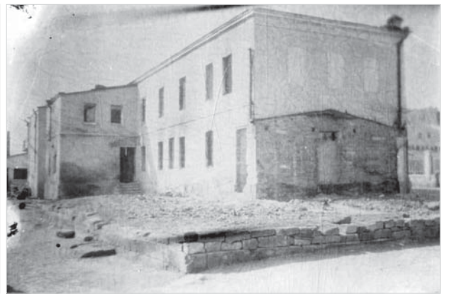
Ставрополь. Гостиница №1 (вид со двора). 26 апреля 1943 года.