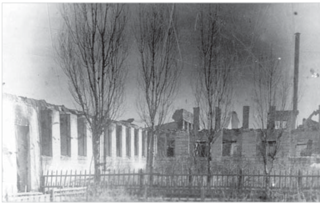
Ставрополь. Мясокомбинат. 10 марта 1943 года.