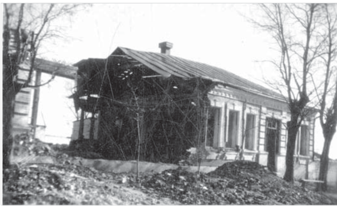
Ставрополь. Радиоузел. 1943 год.