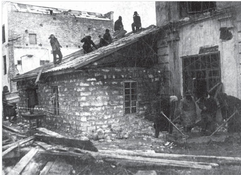
Ставрополь. Швейная фабрика. 21 марта 1943 года.

За пределы края было вывезено 88 тысяч тонн хлеба, 10 800 тонн шерсти, в том числе из Невинномысской шерстомойки – 7 300 тонн шерсти и кож – 712 тысяч штук. Всего из Орджоникидзевского края, Ростовской области и Калмыкии было эвакуировано 2 240 тысяч голов скота: крупного рогатого скота – 670 тысяч голов, 180 тысяч лошадей, 1 390 тысяч овец.