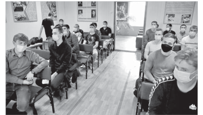
Первый день призывной кампании.

Осенние каникулы у ставропольских школьников должны будут пройти по графику, с 1 по 7 ноября, рассказал на брифинге в правительстве региона министр образования Ставрополя Евгений Козюра.