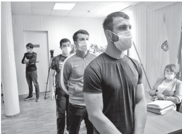
Будущие защитники Отечества.