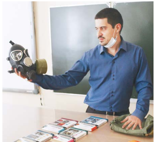
Изучаем устройство противогАЗа.

– Очень безопасно жить! Потому что уроки ОБЖ являются главными в школьной программе, ведь нам надо научить детей ответственности за безопасность жизни и грамотным действиям в условиях ЧС. Мы живем в суровом мире, и вопрос выживания остро стоит на повестке дня. При правильном преподавании урок ОБЖ станет еще и «Островом безмятежной жизни».