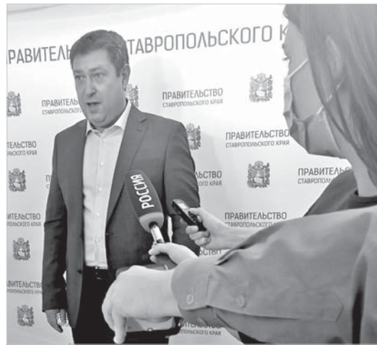
Министр здравоохранения Ставропольского края Владимир Колесников.

Как правило, около четверти заболевших переносят COVID-19 бессимптомно или в легкой форме, подавляющее большинство имеют симптомы средней степени тяжести, и у 8 - 9 процентов отмечается тяжелое течение болез-