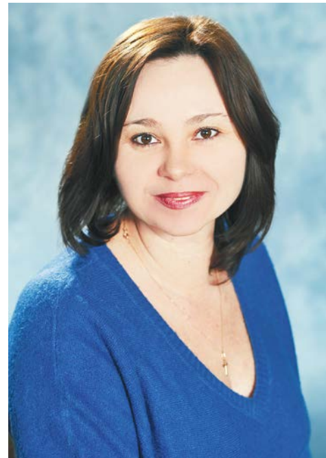
Она убеждена, что история и обществознание — предметы живые.