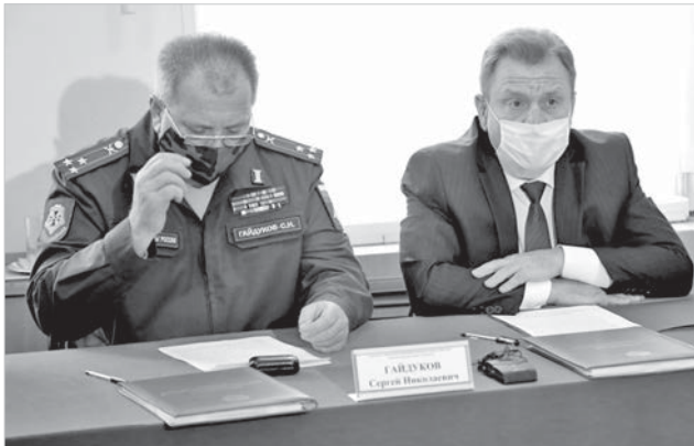
Председатель городской призывной комиссии глава города Иван Ульянченко и военный комиссар Ставрополя Сергей Гайдуков.

В стране стартовал осенний призыв. В Ставрополе осенняя призывная кампания тоже началась 1 октября. Переносов по срокам в связи с эпидемиологической ситуацией в этот раз нет. И сокращения численности призываемых на службу в Вооруженные силы тоже нет. Осенью город отправит в войска порядка 300 человек.