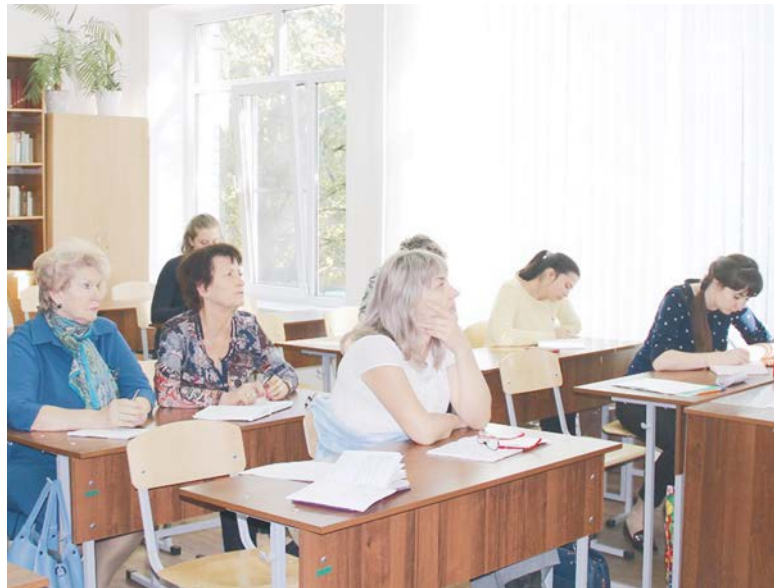
И учителя сидят за партами...

Сегодня «Вечерка» рассказывает своим читателям о «мозге» образования города Ставрополя — руководителях методических объединений учителей. Они-то уж точно знают миллион способов сделать каждый свой урок интересным! А эти самые методики преподавания того или иного предмета разрабатывают в