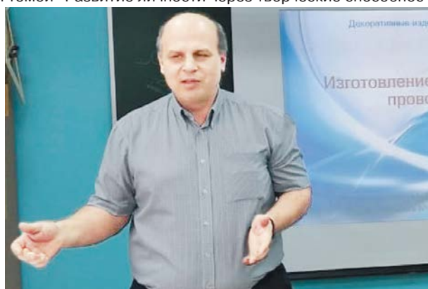
Тихо! Идет урок технологии.