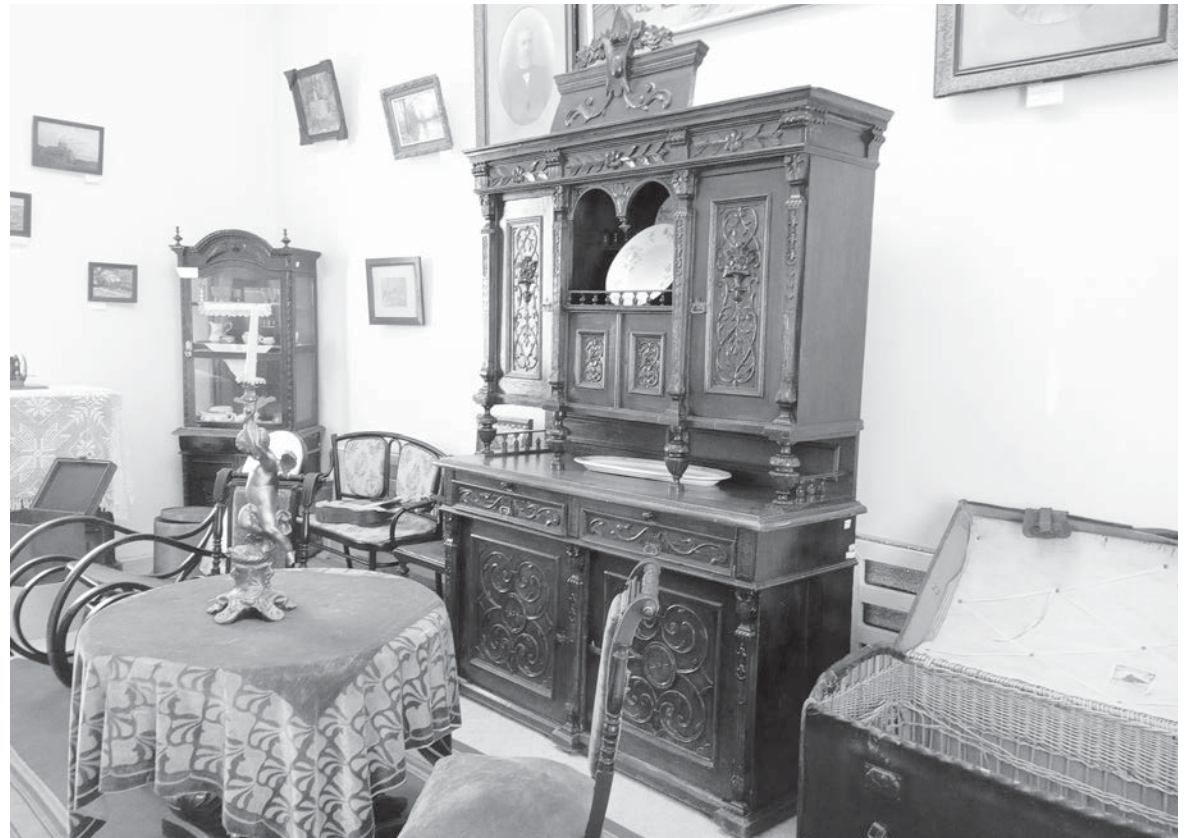
В одном из залов Кисловодского историко-краеведческого музея «Крепость».

Для Кисловодского историко-краеведческого музея «Крепость» нынешний год оказался не только трудным (как, впрочем, для всех учреждений культуры), но и юбилейным. Особенно обидно, что свое 55-летие ему не пришлось торжес-