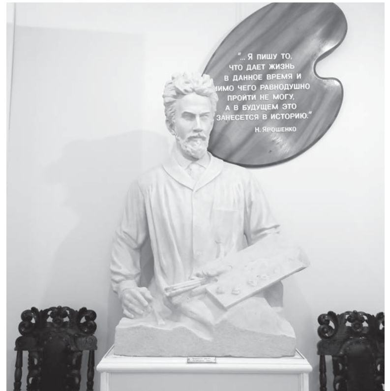
Скульптурный портрет художника Николая Ярошенко работы Сергея Коненкова на «Белой вилле».

Факт, который меня поразил: Кисловодский историко-краеведческий музей «Крепость» в «допан-