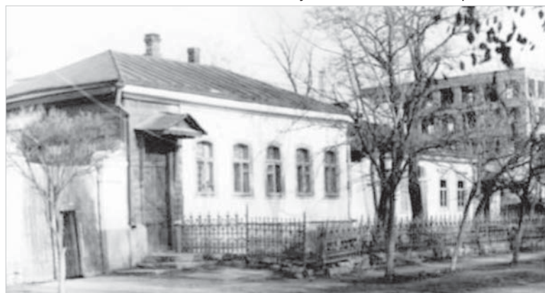
Здание ОВД Петровского района, г. Светлогорск, ул. Пушкина (бывший купеческий дом). 1965 год.

Наталья АРДАЛИНА.