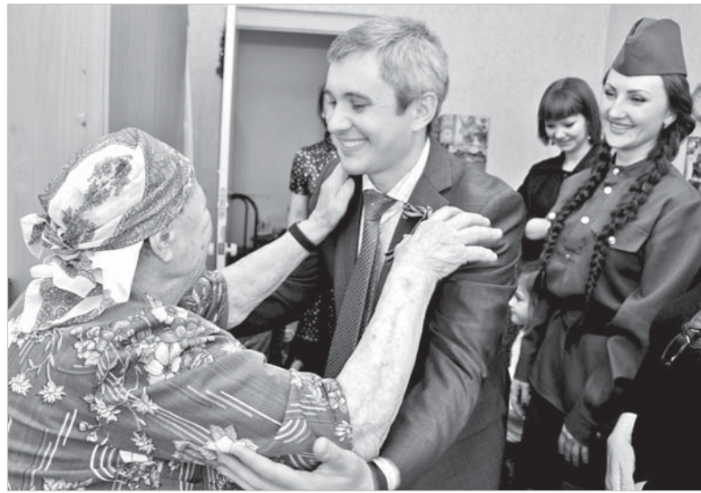
Нотариусам всегда рады в Центре, май 2013 года.

Дмитрий УСТИНОВ.