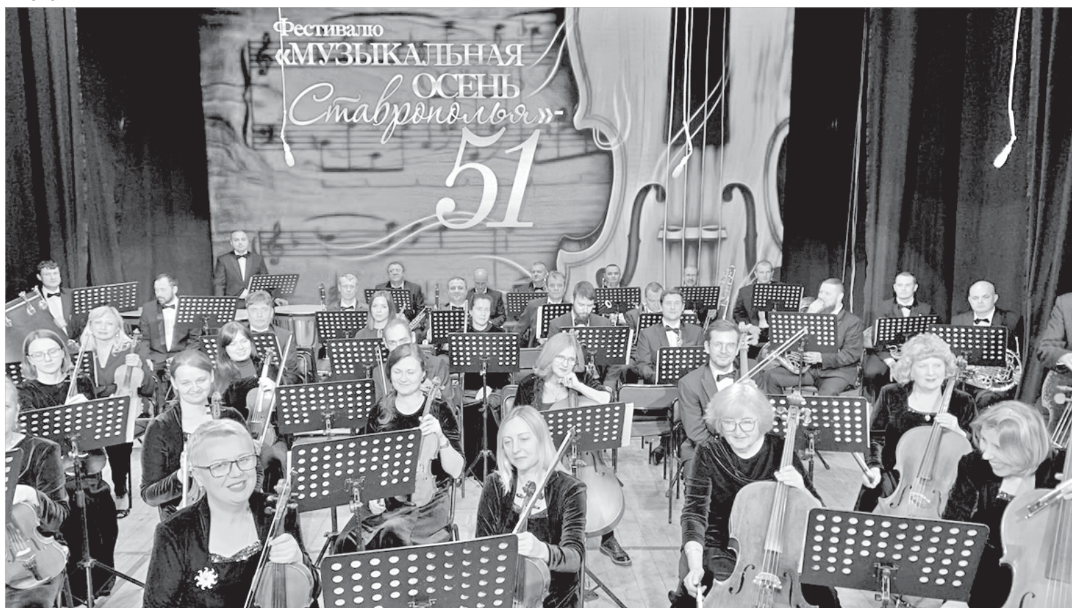
Вечер открытия фестиваля: музыканты симфонического оркестра Ставропольской филармонии.