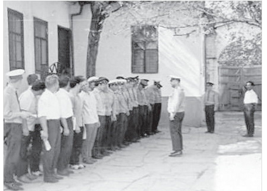
Развод личного состава. 1969 год.