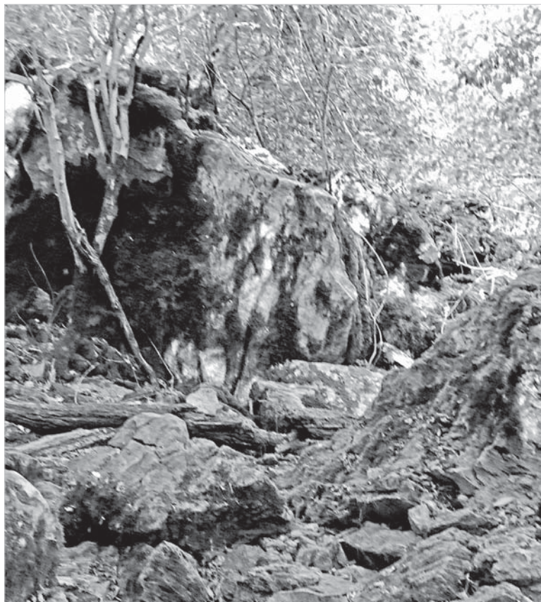
В Каменном хаосе.

Погода выдалась солнечная, но ветреная и прохладная. Не нарушая окружающей среды, тропа достаточно удобно проложена и хорошо оборудована. Она начинается на северо-западном склоне и поднимается постепенно. Ведь Стрижамент – не гора в классическом смысле слова, а плоская вытянутая возвышенность. На неё мы и взбираемся траверсом – перемещением практически по горизонтальной плоскости. Сначала медленно набираем высоту, а потом