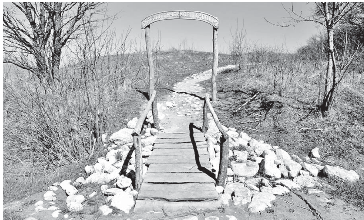
Экологическая тропа.

То же самое можно сказать и про флору. На горе расположен самый крайний северо-восточный ареал произрастания бука. Здесь эти деревья приспособились к засушливому для них климату. Саженицы отсюда интродуцируются – то есть специально пересаживаются – в другие районы Ставрополья, в том числе на Кавказские Минеральные Воды. Также на территории заказника массово растут дубы – священное дерево для многих народов Северного Кавказа. На севере, востоке и западе горы произрастают дубово-грабово-ясеневые леса, в которых встречаются также ильм, клён, яблоня, груша, дикие черешни.