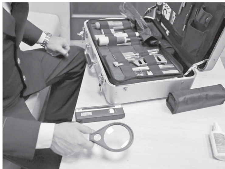
Чемодан криминалиста скрывает много полезных приспособлений.

Но причастность парочки к убийству быстро отпала — женщина выставила их из квартиры сразу по приезде, и этот факт подтвердили соседи. И мать, и сын на тот момент были живы, женщина даже ушла ненадолго из дома по своим делам. Но что-