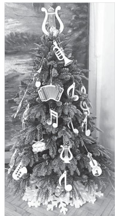
Гостей вечера встречала «музыкальная» ёлочка.