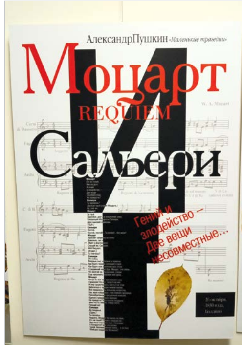
Сергей Майоров. «Маленькие трагедии» (из серии плакатов, посвященных Году театра).