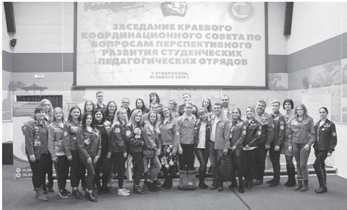
Именно в Северной столице в 2020 году пройдет Всероссийский слет студенческих отрядов, участие в котором примут творчестве. Теперь хотелось бы взять курс на Санкт-Петербург.

- Участие студенческих отрядов Ставрополя во Всероссийском слете студенческих отрядов в Москве показало, что мы на многое способны и в спорте, и в