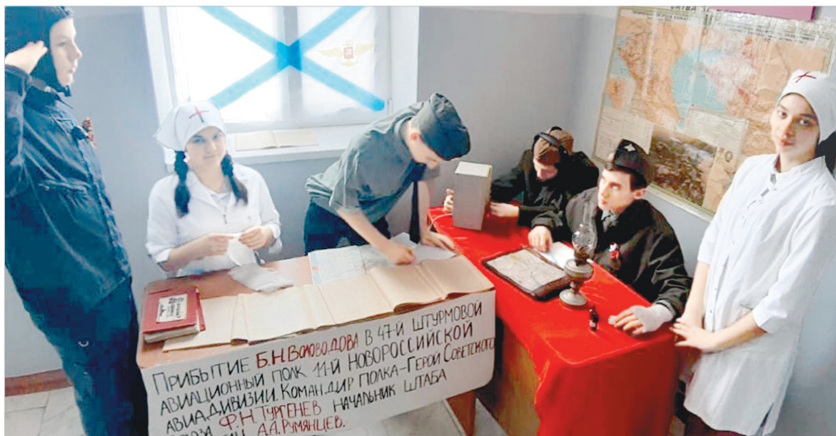
«Живая картина»: «Прибытие Б.Н. Воловодова в 47-й штурмовой авиационный полк 11-й Новороссийской авиадивизии».