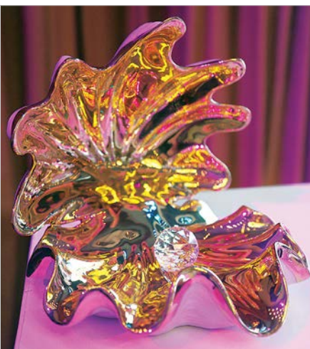
Призы конкурсов ждут своих хозяев.

«Педдебют») боролись 24 учителя Ставрополя; девять из них - молодые педагоги.