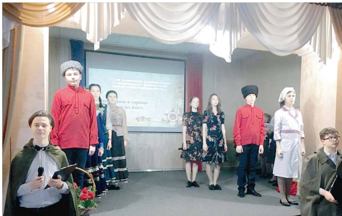
На сцене историко-литературно-музыкальная композиция «Эхо войны в сердце каждого из нас...».