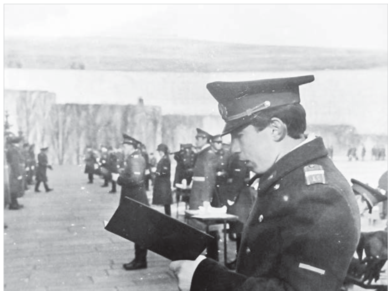
Присяга на Мамаевом кургане.