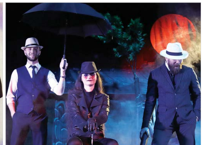
«Псы с городских окраин».