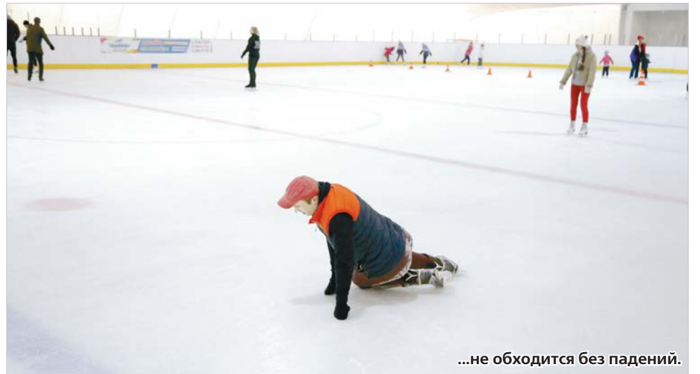
...не обходится без падений.