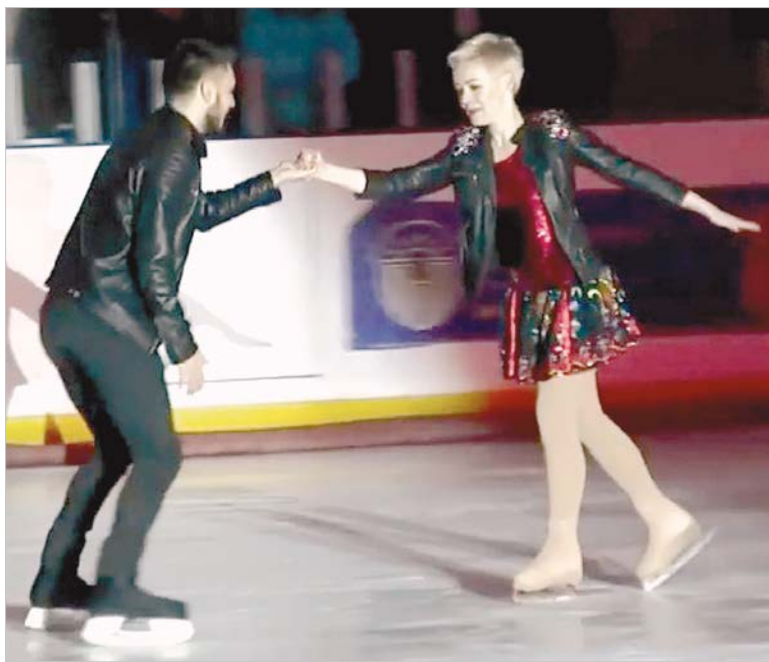
Участники первого сезона «Ставропольские звезды на льду».

В нашем южном, солнечном даже зимой крае зимние виды спорта не так распространены, как где-нибудь в Сибири, где каждый школьник с детства умеет передвигаться на лыжах и уверенно стоять на коньках. Может быть, еще и поэтому большинство из нас с восторгом следят за выступлениями фигуристов, вытворяющих на льду что-то невероятное. Кажется, нормальному человеку не то что четверные прыжки выполнять, просто передвигаться, оторвавшись от бортика катка, и то непросто. Но есть люди, которые доказывают: лед хоть и скользкий, но совсем не страшный, и у каждого, независимо от возраста, есть шанс научиться выполнять хотя бы элементарные движения на коньках, а главное - получать настоящее удовольствие от нахождения на катке.