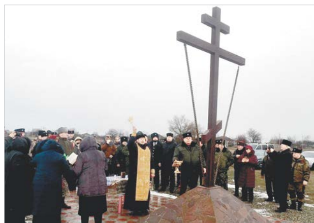
Освящение поклонного креста.

место, и попросили казаков станицы его облагородить. В 2012 году казаки поставили небольшой крест и стали охранять территорию от желающих устроить здесь свалку. А в 2019 году, когда была собрана необходимая сумма, активно взялись за благоустройство святыни: вырыли небольшой котлован под закладную, залили бетоном, выложили тротуарной плиткой площадку для молящихся, установили тумбу, сделали гранитную надпись и, наконец, поставили четырехметровый металлический крест.