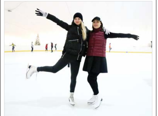
Участники проекта «Ставропольские звезды на льду. Новый сезон».

Каток «Виктория» расположен по адресу: г. Ставрополь, ул. Серова, 535а. Вход на ледовое шоу по приглашениям.