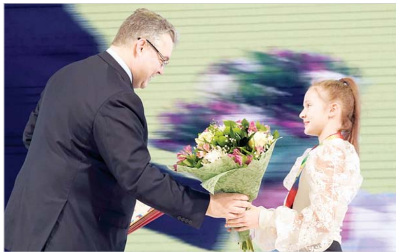
Губернатор Ставропольского края вручает награды одаренным школьникам.

Глава региона вручил дипломы лауреатам краевой молодежной