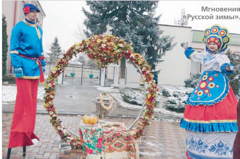
Мгновения «Русской зимы».

Завершился праздник задорным выступлением ансамбля песни и пляски «Казачки Кавказа» из города Ессентуки.