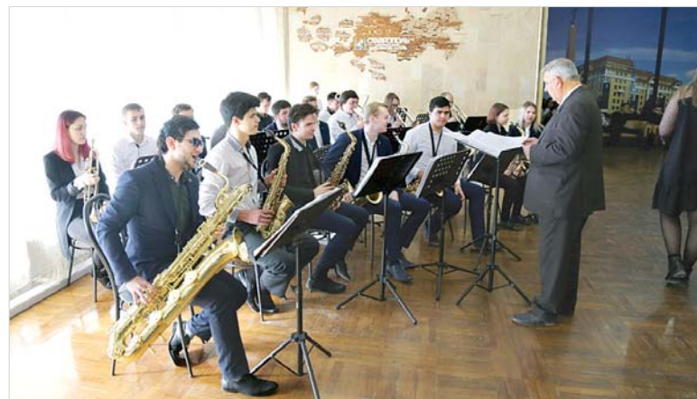
Для гостей церемонии звучала живая музыка.

вручил удостоверения стипендиатам губернатора – 45 юным спортсменам Ставрополья и 11 учащимся и студентам образова-