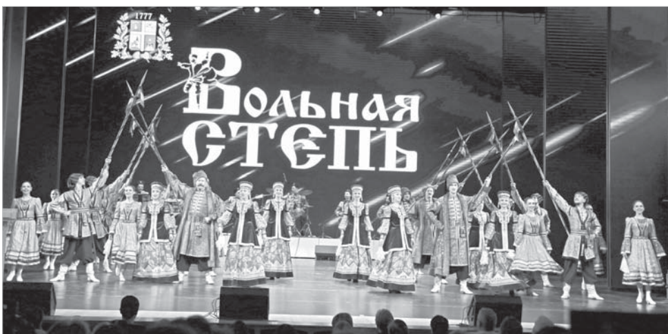
На сцене – «Вольная степь».