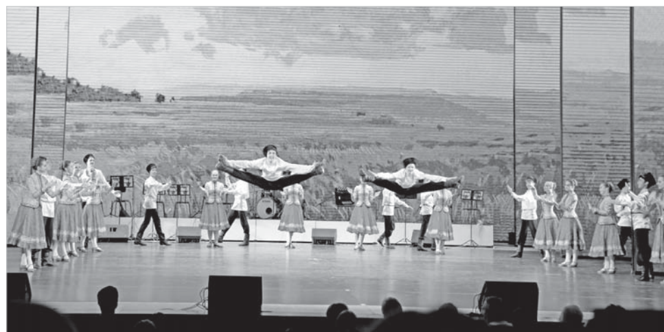
Танцует ставропольская «Радуга».

В минувшую пятницу во Дворце культуры и спорта состоялся большой сборный концерт, посвященный 15-летию муниципального казачьего ансамбля песни и пляски «Вольная степь».