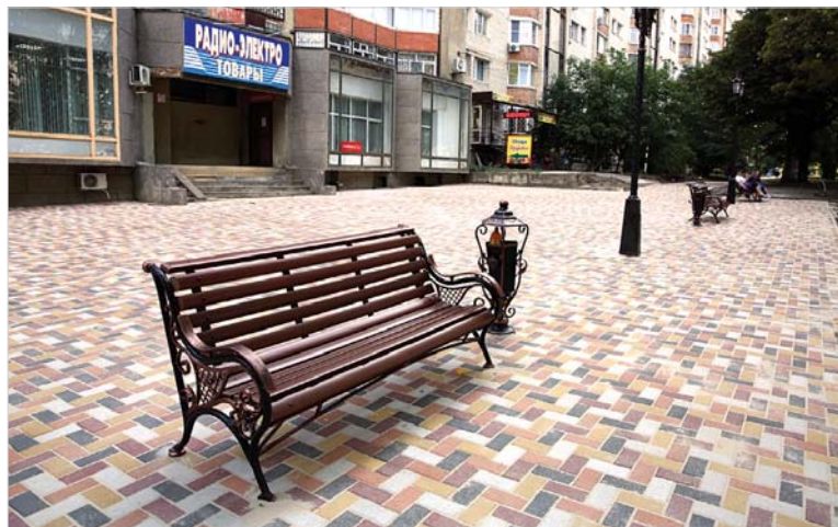
На месте неприглядных конструкций появляются благоустроенные зоны отдыха.

После окончательного демонтажа магазина по ул. Доваторцев приведут в порядок и эту территорию: оформят тротуарной плиткой площадку и установят современный остановочный павильон.