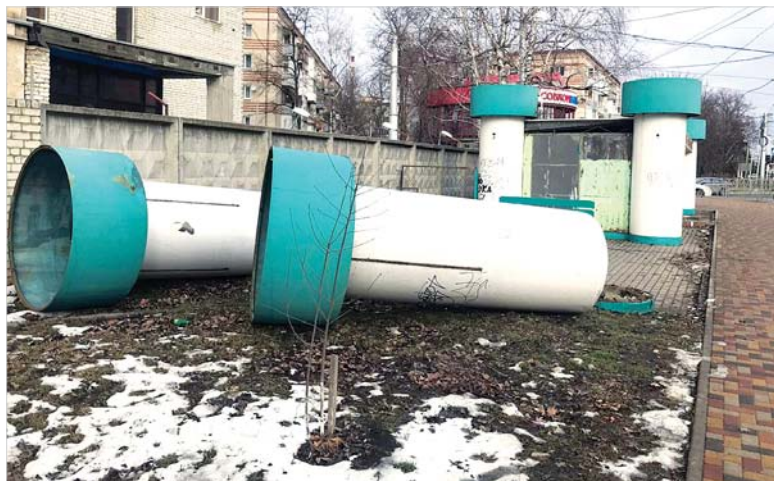
Продолжается демонтаж незаконных ларьков.

В краевом центре на протяжении нескольких лет ведется борьба с незаконно установленными торговыми объектами, которые портят внешний вид города. В прошлом году было снесено 12 капитальных