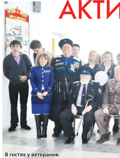
Актив Совета казачек.