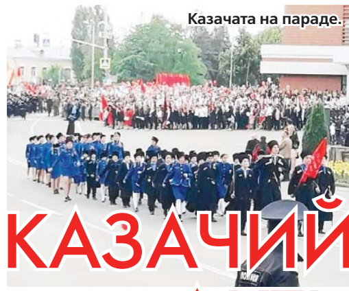
Казачата на параде.