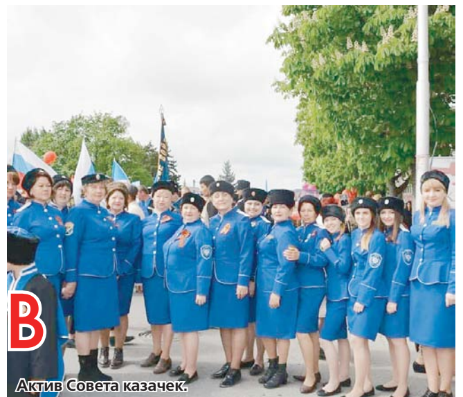
Актив Совета казачек.

«КАЗАЧИЙ СПАС» На базе Ипатовского многопрофильного техникума прошло открытое первенство Ипатовского городского округа по русскому кулачному бою «Казачий Спас - 2020», посвященное 31-й годовщине вывода советских войск из Афганистана и Дню защитника Отечества. Соревнования организовало Ипатовское станичное казачье общество. В турнире приняло участие шесть команд Ипатовского округа: из города Ипатово, сел Октябрьского, Кевсала, поселка Советское Руно. Более 60 бойцов доказывали, что они будущие воины с сильным духом и крепкими кулаками, что они умеют не только держать удар, но с достоинством принимать и победу, и поражение. На двух площадках бились мальчики от 8 до 18 лет. По старой русской традиции после поединка казачата по-братски обнимались и просили друг у друга прощения.