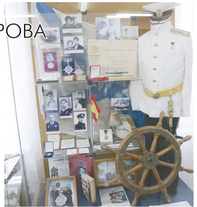
В музейной экспозиции Героя Советского Союза Ивана Алексеевича Бурмистрова.