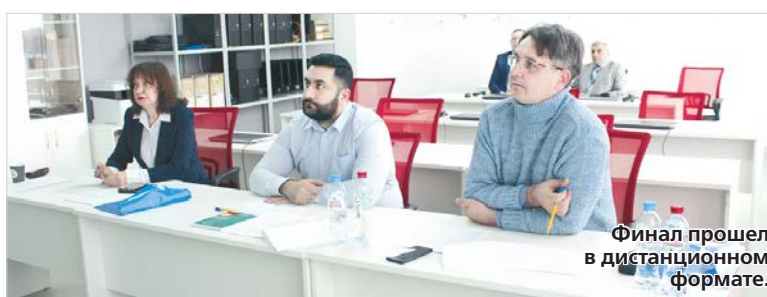
Финал прошел в дистанционном формате.

этапа конкурса выступили ведущие ученые и руководители малых инновационных и промышленных предприятий региона.