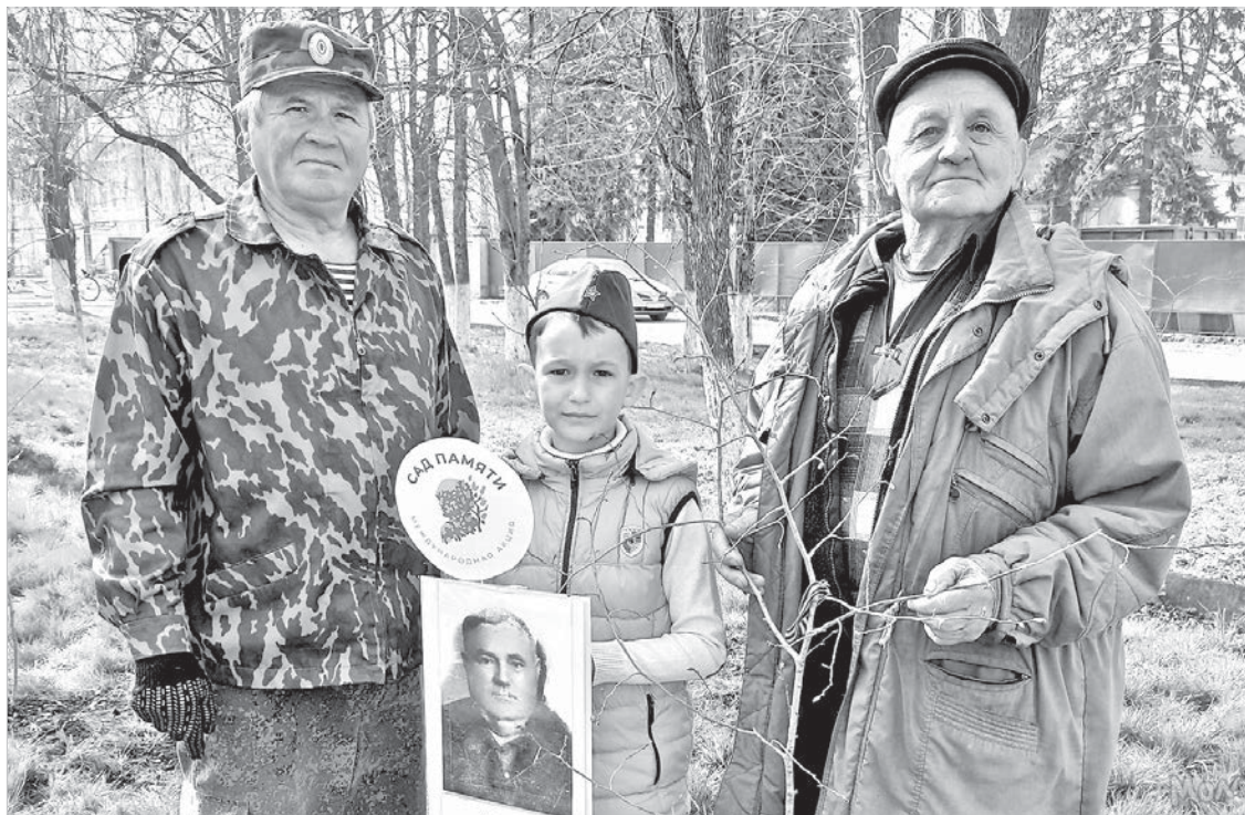
Ставропольские «садовники» трех поколений.

Международная акция «Сад памяти» подводит итоги первого месяца своей деятельности. За это время ее участники посадили более 5,5 миллиона деревьев.