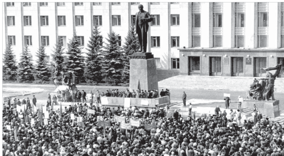
Памятник Ленину в Ставрополе в 90-е годы XX века был главным местом притяжения для митингующих.