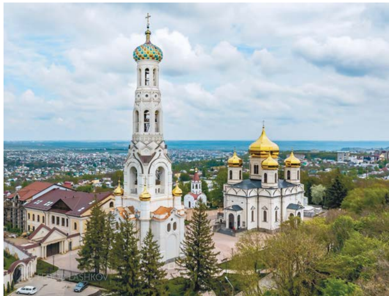
Казанский кафедральный собор в Ставрополе. Из фотопроекта «Открывая Ставрополь».

Крестовоздвиженская церковь, расположенная на улице Голенева и построенная более полутора веков назад, с 20-х годов прошлого века до 1990 года была закрыта.