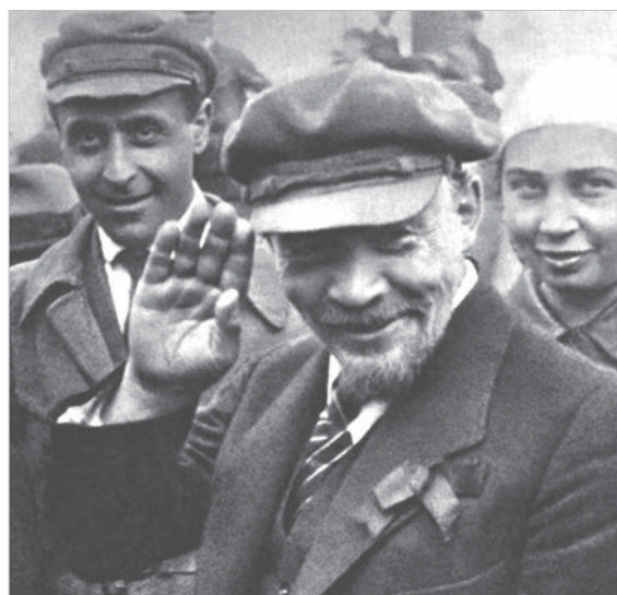
Образ Ленина с этой фотографии стал каноническим. Снимок неизвестного автора был сделан на закладке памятника «Освобожденный труд» в Москве 1 мая 1920 года.

Вокруг памятника Ленину в 90-е годы было много разговоров, и буквальных (в формате митингов), и фигуральных, когда критики советского прошлого активно призывали ставропольцев «зачис-