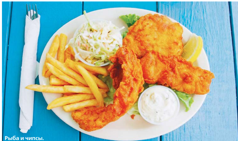
Рыба и чипсы.

Для кляра смешать в глубокой емкости сухие ингредиенты: 2/3 части муки, крахмал и разрыхлитель и немного соли. Размешивая сухие продукты лопаткой, медленно влить пиво. Перемешать до однородной консистенции, влить газированную воду и размешать до исчезновения маленьких комочков.