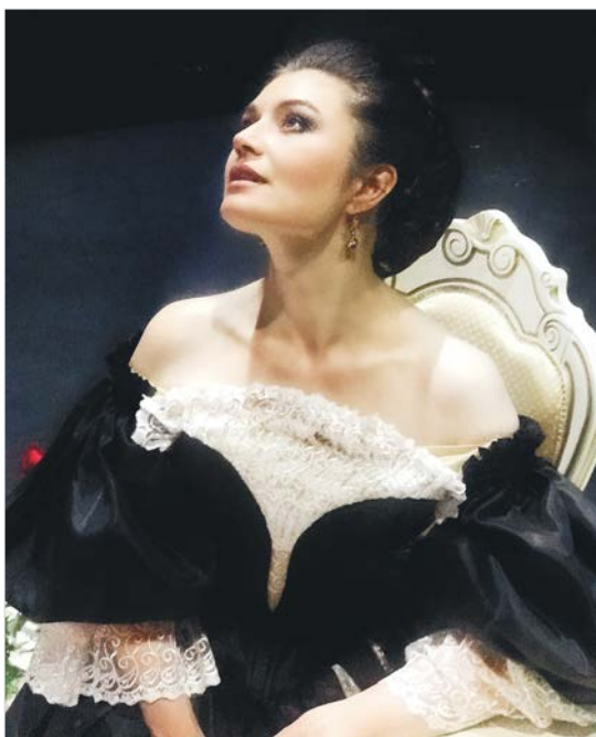
Заслуженная артистка России Ирина Баранникова.