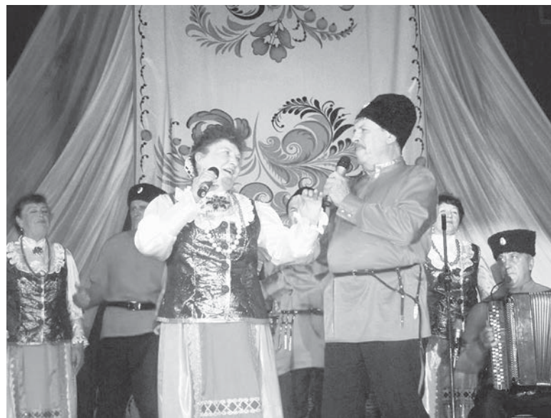
Выступление хора «Русские узоры» в культурно-досуговом центре «Родина», посвященное полувеклому юбилею хора. Невинномысск, 24 мая 2014 года.