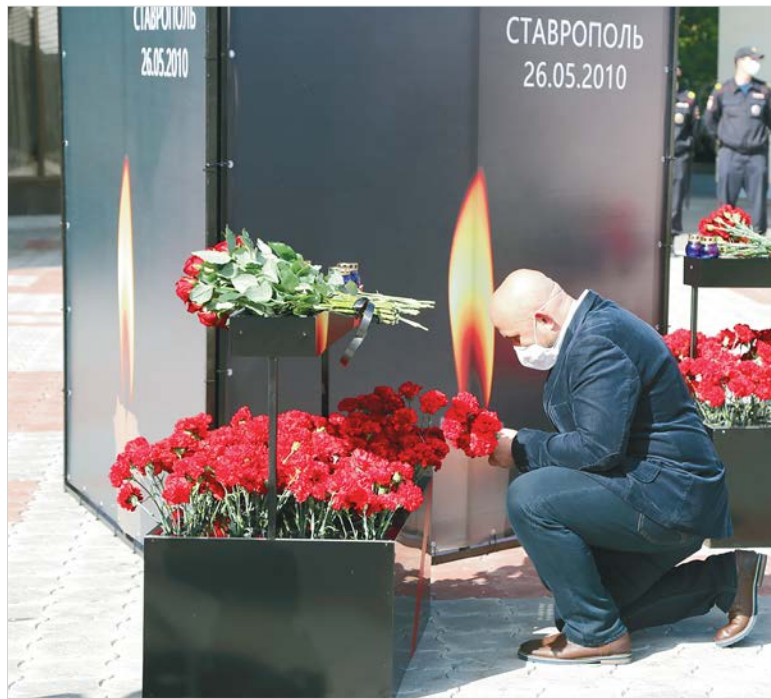
Память и скорбь.