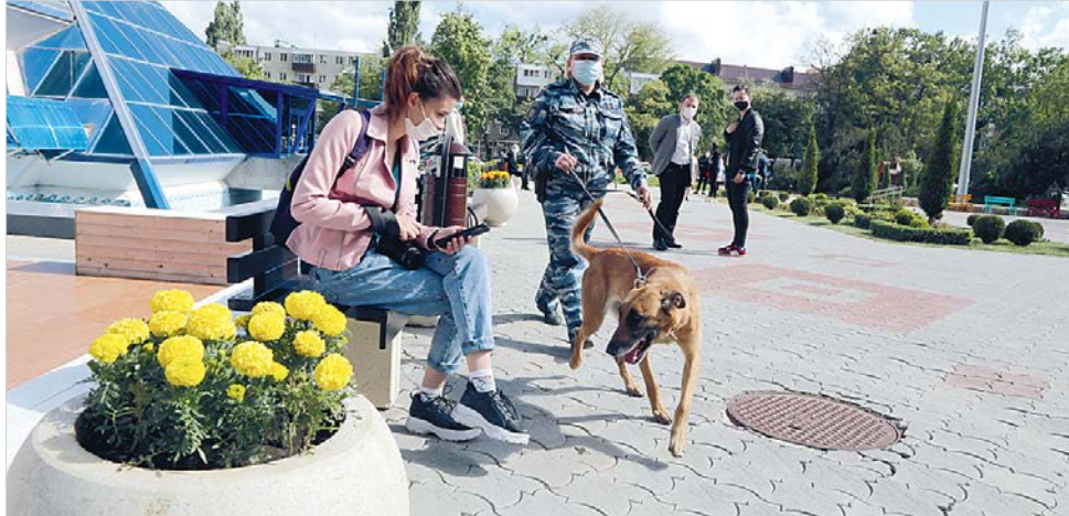
Перед митингом памяти площадь у ДКиС проверяют кинологи с собаками.