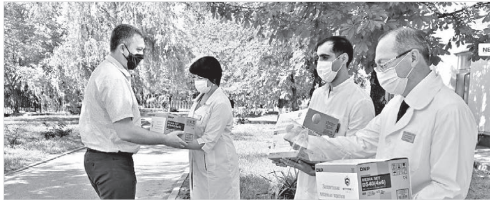
Медикам краевого центра специализированных видов медицинской помощи №1 передали партию защитных экранов.

По данным на 2 июня, больше всего выздоровевших в Ставрополе – 132, Невинномысск – 94, Пятигорске – 150, в Кочубеевском районе – 119. В этих же территориях по-прежнему и наибольшее количество заболевших. На вчерашний