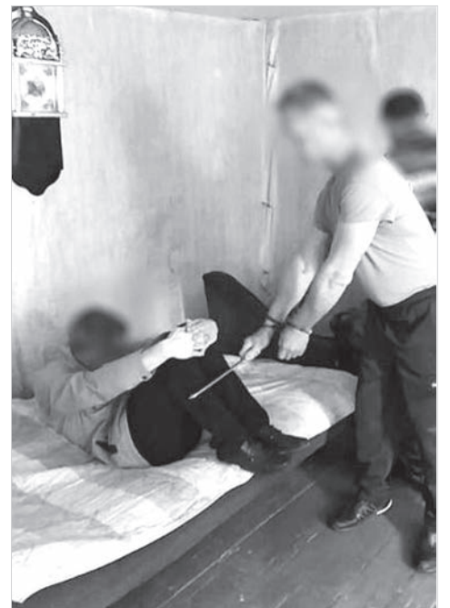
Проверка показаний на месте.

Подозреваемый задержан и заключен под стражу, в отношении него возбуждено уголовное дело по факту причинения тяжкого вреда здоровью человека, повлекшего по неосторожности его смерть, рассказали в краевом управлении СКР.