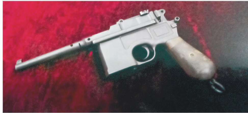
Пистолет Маузер – оружие милиционеров 1920-х годов.