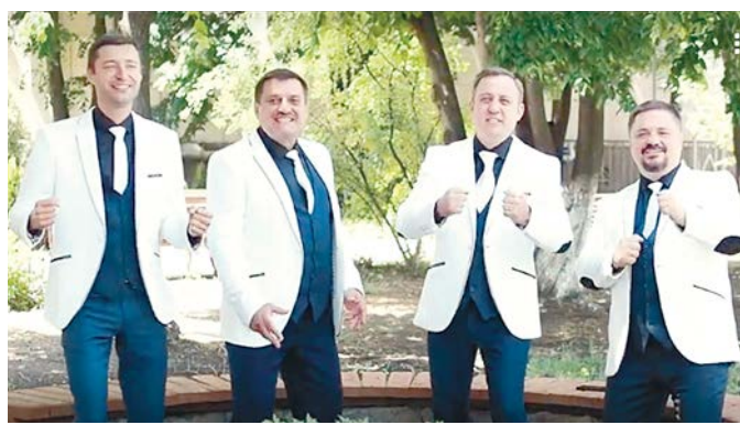
Ансамбль из Краснодара поздравляет ставропольскую полицию с юбилеем.

Завершится марафон выступлением вокального ансамбля Управления МВД России по Оренбургской области «Стражи!». Они подготовили для коллег трогательную композицию «Я живу на Ставрополье».