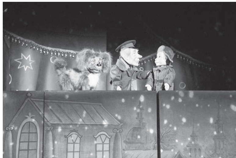
Сцена из спектакля «Каштанка».