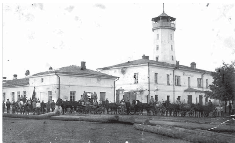
Здание пожарного депо и полиции, начало XX века.