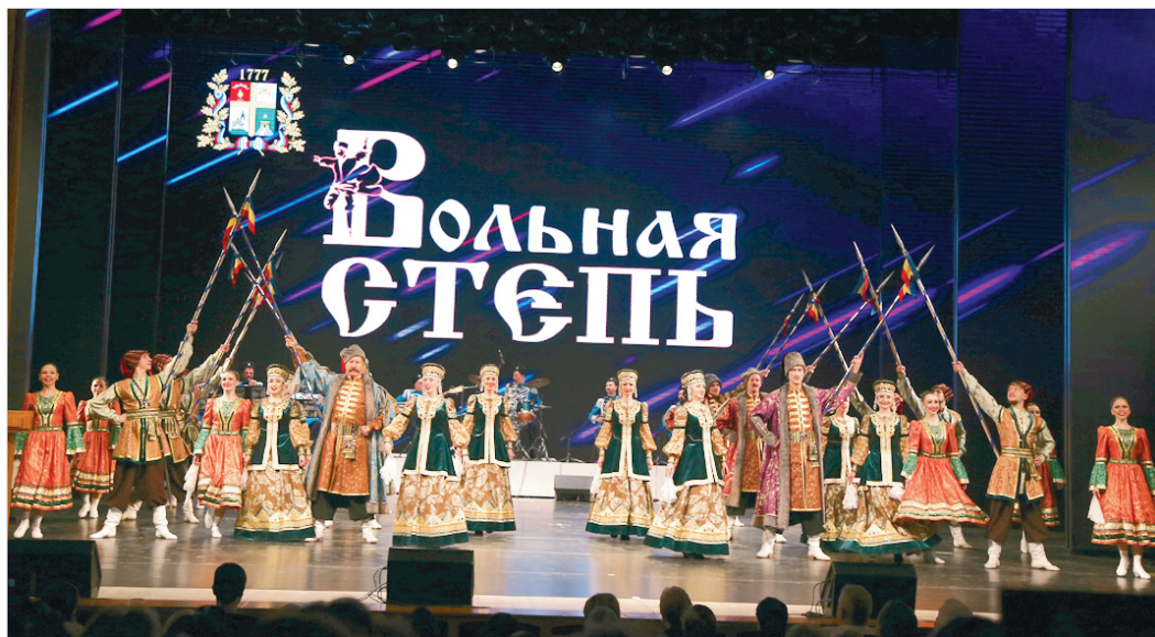
«Вольная степь» – кульминация концертной программы праздника онлайн.