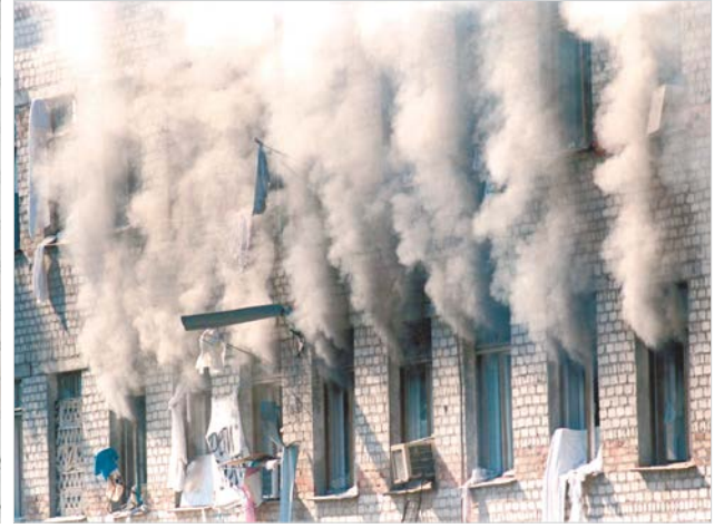
Во время штурма.