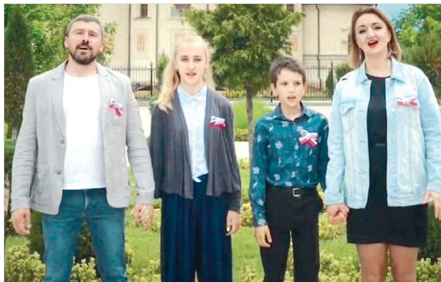
Семьи работников культуры в инстаграме исполнили кавер-версию группы «Любэ».