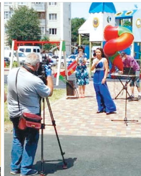
Концерты во дворах.