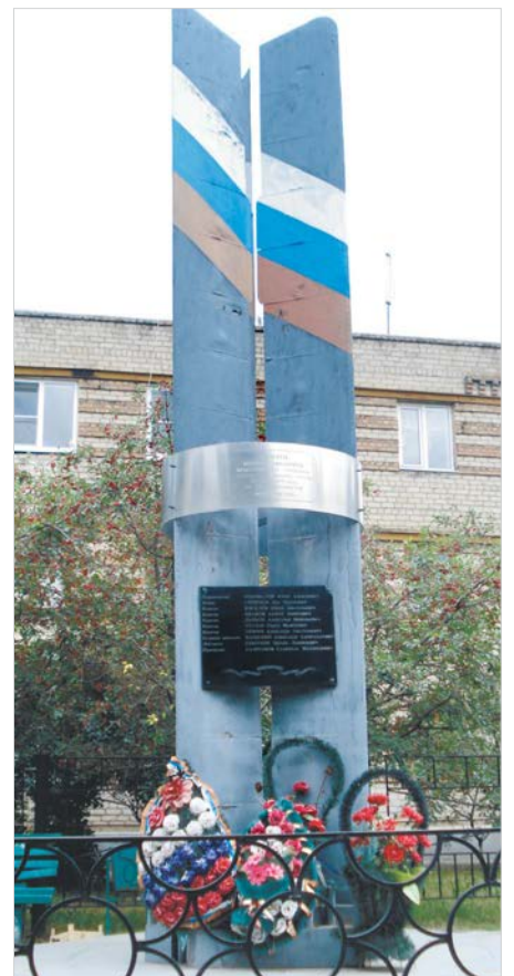
У здания районного отдела внутренних дел – памятник милиционерам, погибшим 14 июня 1995 года.

Елена ПАВЛОВА.