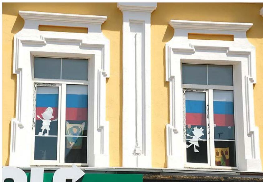
В окнах школ триколоры соседствовали с детскими рисунками.