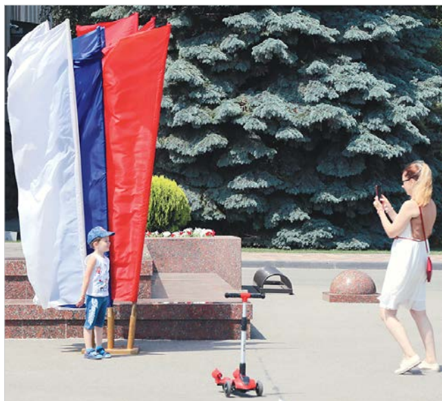
Фото у триколора.