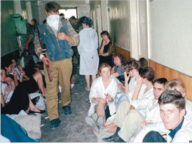
В заложниках оказалось полторы тысячи человек.