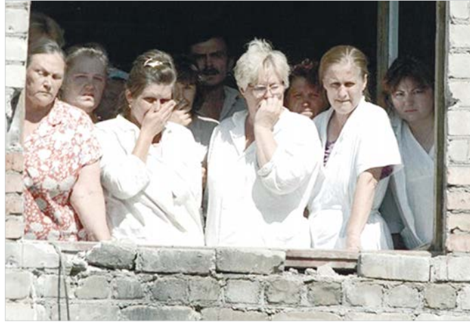
Боевики выставили к окнам женщин в качестве живого щита.