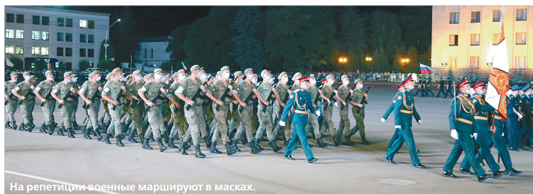
На репетиции военные маршируют в масках.