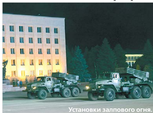
Установки залпового огня.

Подробный материал о предстоящем событии «Вечерний Ставрополь» опубликует непосредственно накануне парада – в номере от 23 июня. По словам организаторов, на данный момент еще уточняются и согласовываются некоторые моменты (в том числе с Роспот-