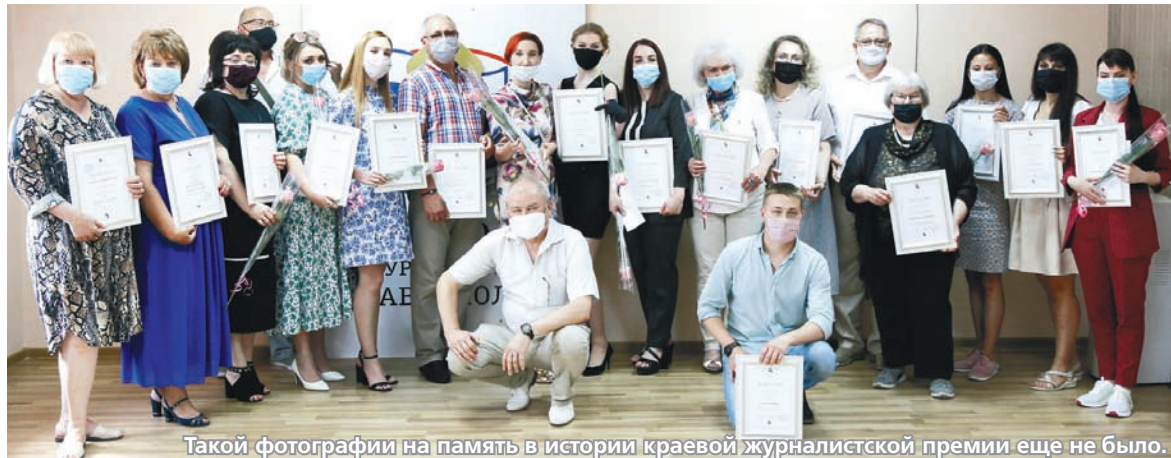
Такой фотографии на память в истории краевой журналистской премии еще не было.