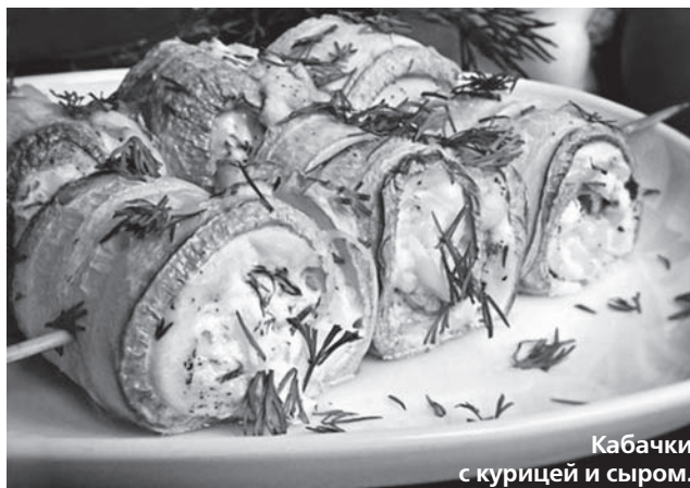
Кабачки с курицей и сыром.

Форму обильно смазать и присыпать панировочными сухарями или манной крупой. Включить духовку, чтобы она разогрелась.