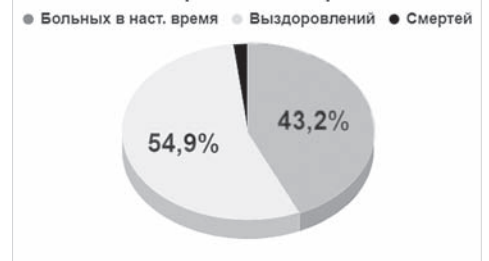
Структура заражений CoVID-19 в Ставропольском крае

тике новой коронавирусной инфекции, в том числе и в дистанционном режиме. Такое обучение прошли порядка 6 тысяч человек – врачи, медсестры, преподаватели, студенты и волонтеры.