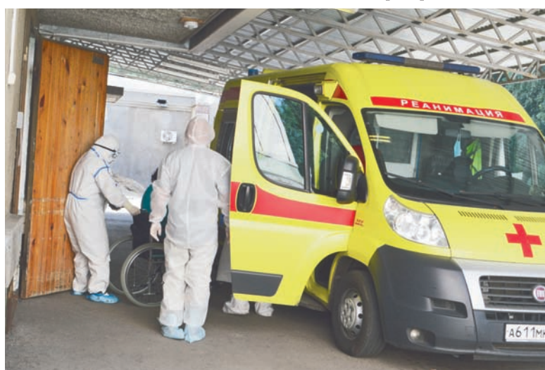
Реанимобиль привез больную из Благодарного.