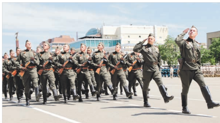
Военнослужащие 49-й армии. Оружие и форма образца военных 40-х.

Время летит стремительно – солдатам Победы, даже самым молодым из них, кому весной 1945-го было чуть за 20, сейчас уже далеко за 90. Их немного осталось, и не все смогли по состоянию здоровья присутствовать на параде. Но, конечно же, все ветераны – и приехавшие на праздник, и те, кто смотрел его трансляцию по телевизору, – испытывали радость, когда по площади проходили сводные группы боевых частей Ставропольского гарнизона. Ведь нынешние солдаты