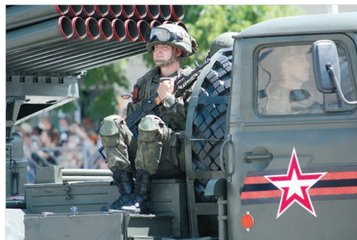
«Грады» и «Ураганы» – «внуки» легендарной «Катюши».