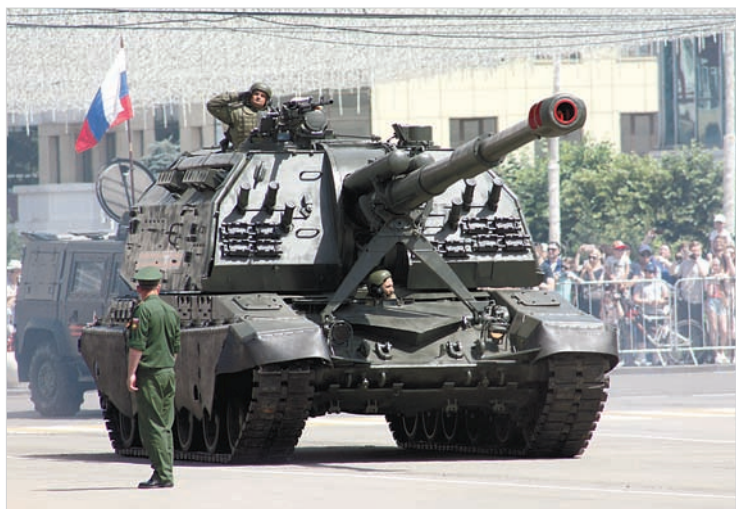
МСТА – самая современная самоходка.