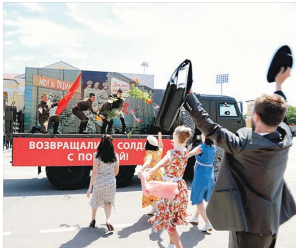
Победителей забрасывали цветами.