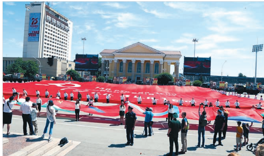
Самая большая в мире копия знамени Победы.