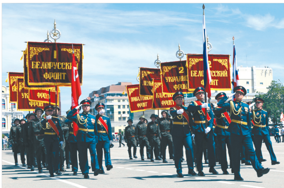
Знамена советских фронтов.