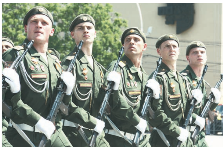
Сегодня эти солдаты и офицеры продолжают традиции подвига.