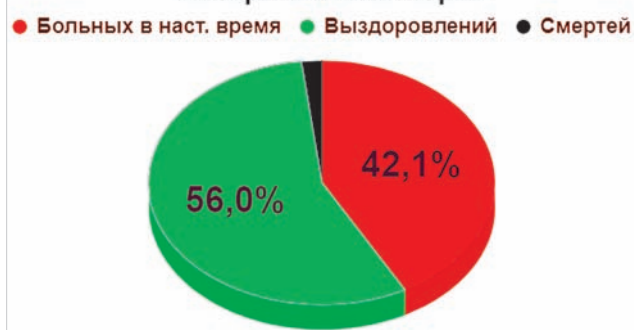
Структура заражений CoVID-19 в Ставропольском крае