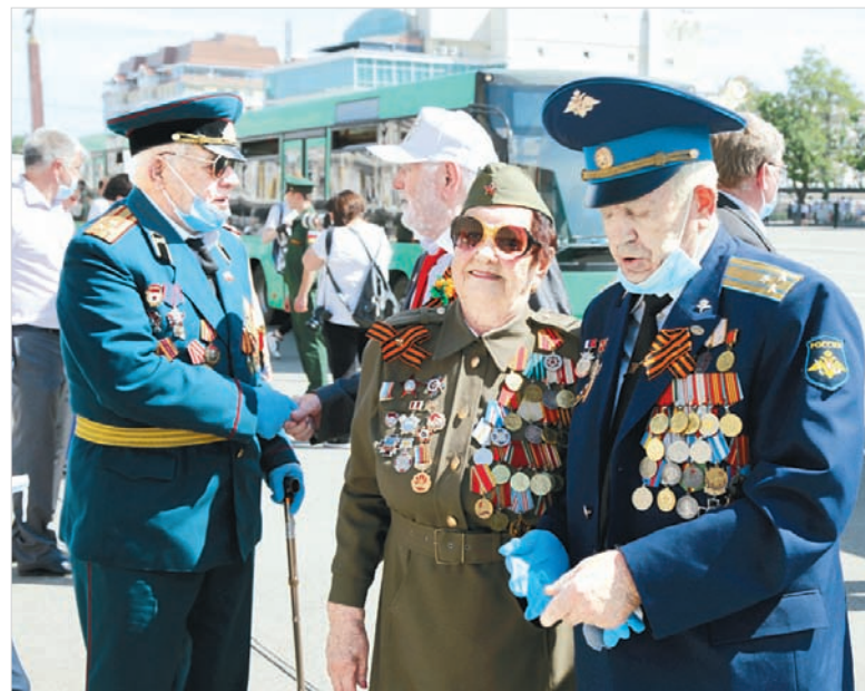
Радость в глазах ветеранов.