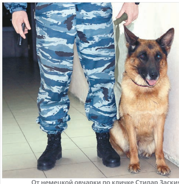
От немецкой овчарки по кличке Стилар Заския наркотики не спрячешь.