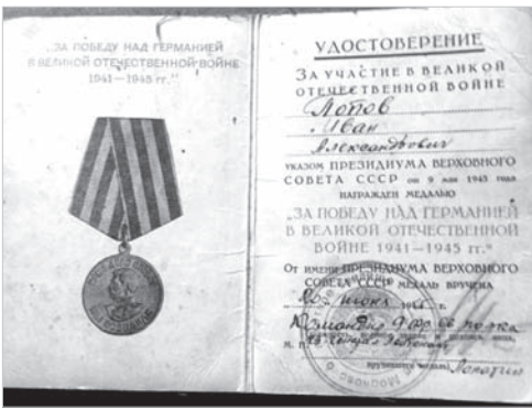
Медаль «За победу над Германией в Великой Отечественной войне 1941-1945 гг.».

дат, промаршировавших по брусчатке Красной площади в составе десяти сводных полков всех фронтов и боевых частей Военно-Морского флота, а также 24 тысячи служащих подразделений НКВД, Московского гарнизона, военных и суворовских училищ.