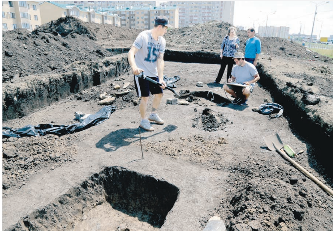
Археологические раскопки на могильнике Грушевского городища. Июнь 2020 года.

ление об археологии людей, далеких от этой науки. Сплошная романтика... Не без этого, конечно, но в первую очередь археология – это тяжелый физический труд, огромный объем знаний, аналитические способности и даже, если хотите, профессиональная интуиция.