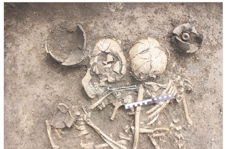
«Ромео и Джульетта»: фотография этой находки в соцсетях вызвала романтические ассоциации.