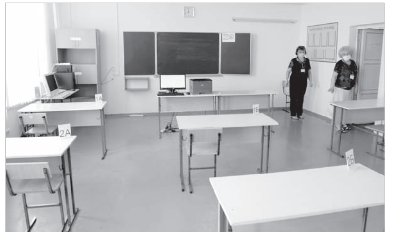
В 19-й школе Ставрополя аудитории готовы к проведению ЕГЭ-2020.