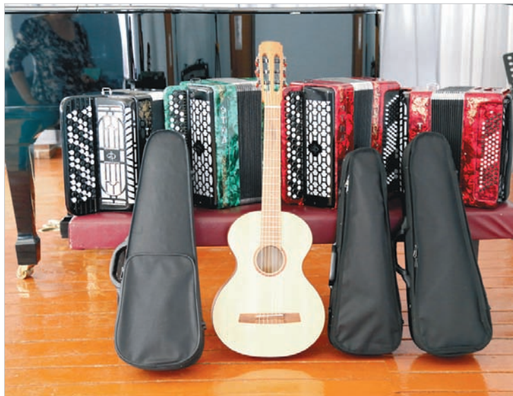
Благодаря реализации регионального проекта «Культурная среда» в ДШИ №4 приобрели новые музыкальные инструменты.

Завершение учебного года в детских школах искусств на Ставрополье стало необычным во многих отношениях. В условиях действующих ограничений из-за распространения коронавируса занятия с учащимися были организованы в дистанционном режиме. Вручение выпускникам документов об окончании школы проходило не в торжественной обстановке, как это было всегда, а в индивидуальном порядке с соблюдением всех санитарно-эпидемиологических требований. Однако ряд школ искусств Ставропольского края весна нынешнего года порадовала позитивными переменами: в рамках реализации регионального проекта «Культурная среда», который входит в национальный проект «Культура», они смогли приобрести новые музыкальные инструменты, современное оборудование и музыкальную литературу.