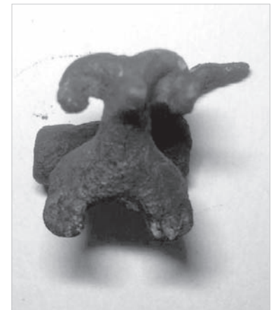
Одна из бронзовых находок июня 2020 года.