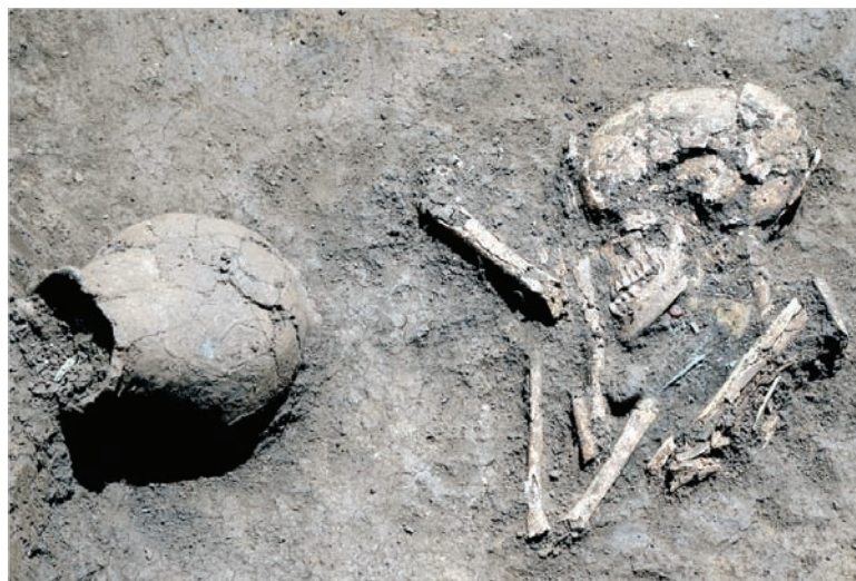
По традиции «кобанцы» помещали в могилу умершего горшочек с кашей.