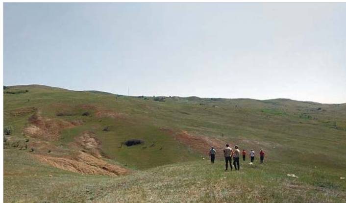
На этом месте в августе 1942-го немцы расстреляли 22 человека.

В этот день на раскопках работали 25 поисковиков. Жара была адова. Но никто не пожалел, что принял в этом участие. Любая Вахта памяти тяжела и физически, и психологически. Наверное, это не очень благодарная работа, но благородная. Это очень важная сегодня миссия – возвращать людям утраченную память.