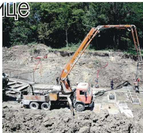
На Комсомольском озере работы в самом разгаре.

«Необходимо, чтобы благоустройство касалось всех сфер жизни горожан. Важна