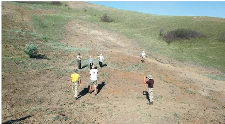
Местные жители знают об этих событиях со слов старожилков.