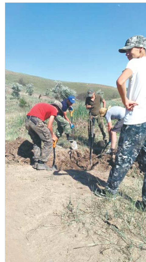
В одном месте георадар показал неоднородность почвы.