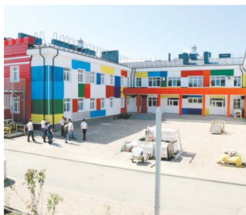
В детском саду на ул. Тюльпановой осталось нанести завершающие штрихи.

социальная составляющая: места для малышей в детских садах, спортивные площадки, комфортные условия для отдыха, красивые локации для прогулок. Сегодня именно такую задачу мы ставим перед собой, - подчеркнул Иван Ульянченко.