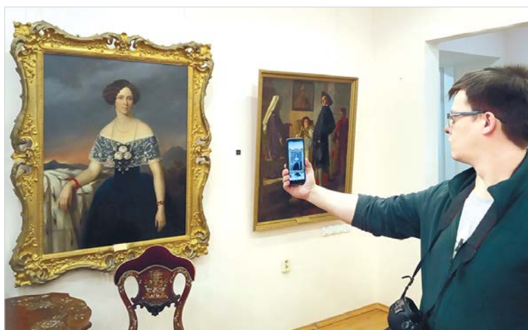
На презентации проекта «Artefact» в январе 2020 года трудно было представить, насколько актуальным станет виртуальный экскурсовод в ближайшее время.

мобильного приложения состоялась в январе нынешнего года. Первоначально на платформу «Artefact» было загружено лишь 40 работ из собрания Ставропольского музея изобразительных искусств, в дальнейшем специалисты планируют перевести в цифровое пространство как можно больше музейных предметов.